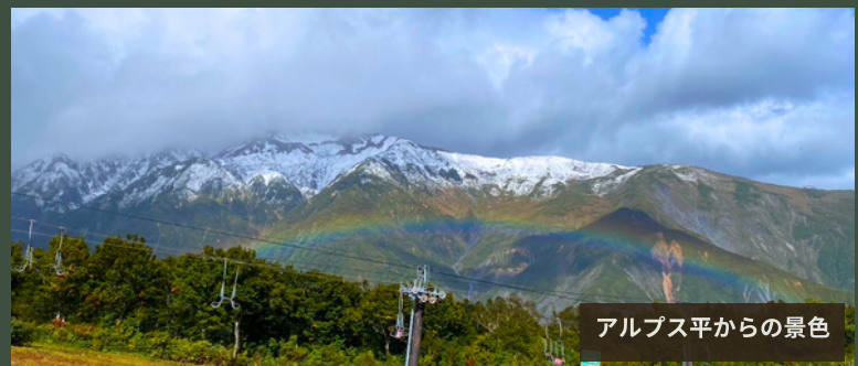
アルプス平からの景色