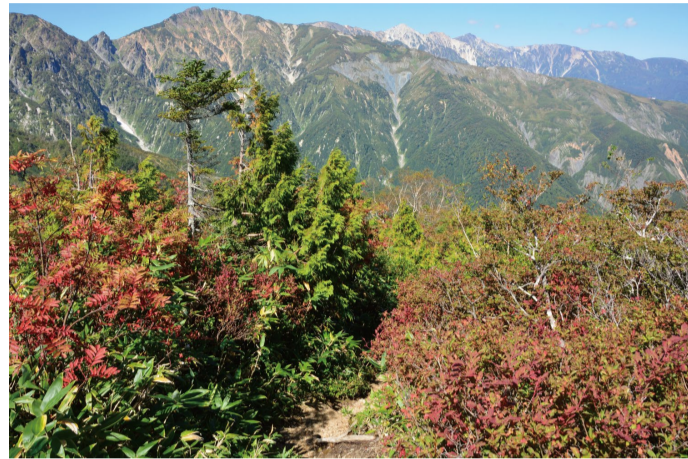
小遠見山山頂付近の紅葉 (9/29 撮影)

2022 紅葉情報 ※9/29 現在の予想です。天候などの状況で変わる場合があります。