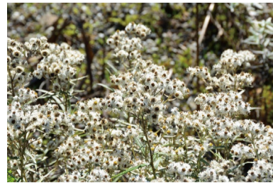
ヤマハハコ (C・E・F・H)

※エリア記号について 植物名のあとにある記号は主に植えられている植物園内の各エリアを表しています。