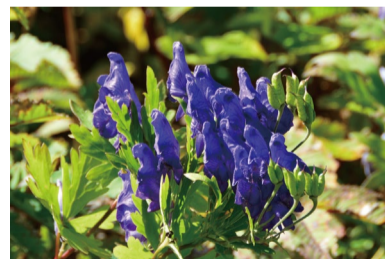
ミヤマトリカブト (C・H)