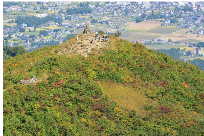
地蔵ケルンを上から見る (9/29 撮影)