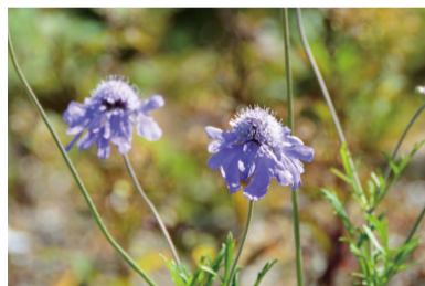
マツムシソウ (C・E・F・H)