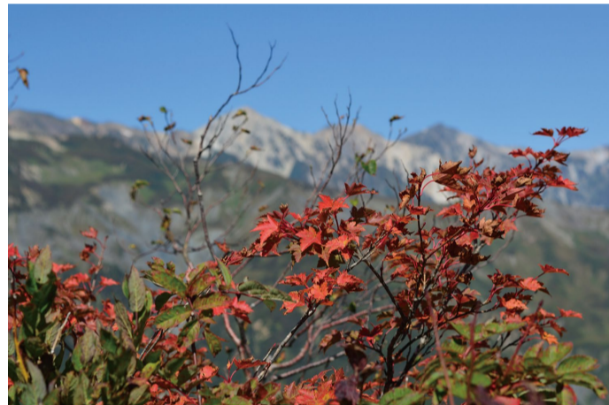
小遠見山トレッキングルートでのミネカエデ (9/29 撮影)