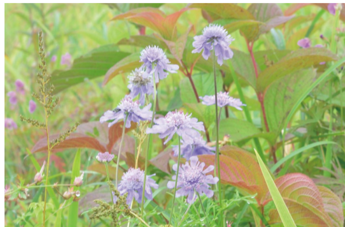
マツムシソウ (C・E・H)

紅葉の季節、10月も目前となった白馬五竜。見ごろの秋の花々を楽しむには、この3連休あたりまでが丁度良いタイミングとなりそうです。名前は知っていても、花には馴染みがないというお客様の多い「ミヤマトリカブト」も開花して見ごろになっています。人気の「コウメバチソウ」や「エゾリンドウ」は見ごろ終盤に差し掛かった印象。また、9/25(日)、26(月)には「絶滅危惧種の保全 成果報告会」を開催いたします。お気軽にご来場ください。