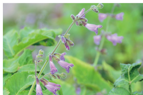
サルビア・サウパルマティネビス (G)