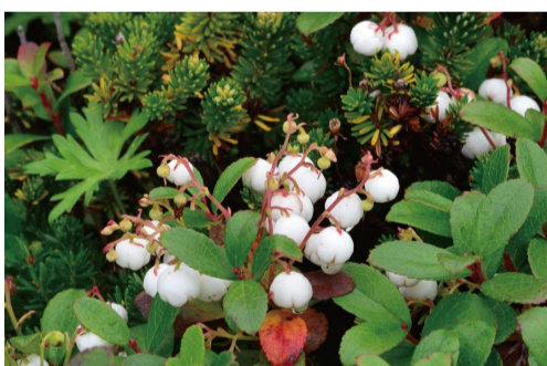
シラタマノキの実 (B)