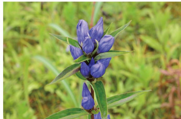
エゾリンドウ (C・D・E・F・H)