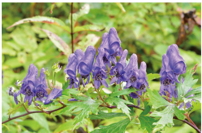
ミヤマトリカブト (C・F・H)