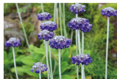
プリムラ・カピタータ (G)