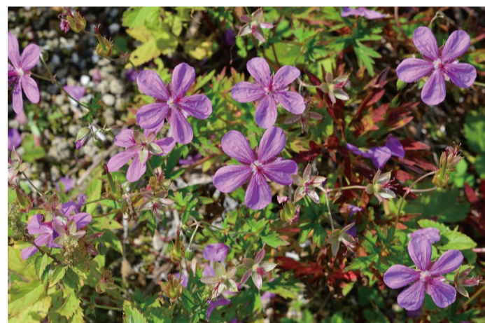
アサマフウロ (C・E・H)