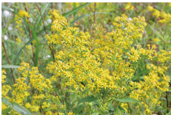
アキノキリンソウ (C・D・H)