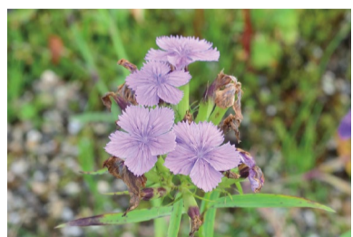
シナノナデシコ (C・H)