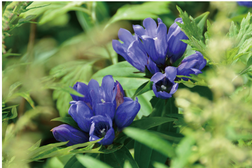
エゾリンドウ (C・D・E・F・H)

白馬五竜ではすっかり秋らしい気候になり、秋の人気の花々が一気に開花して見ごろになっています。「エゾリンドウ」は園内全体に咲いています。アルプス平自然遊歩道の外回りを歩くと「コウメバチソウ」が道すがら沢山咲き、「タムラソウ」の群生なども見られます。又、「ハクサンオミナエシ」、「アキノキリンソウ」の黄色とコオニユリの橙色がキレイ！「コマクサ」もまだ少しだけ咲いています。さらに、この週末は9/10(土)の「台湾フェア」、9/10(土)、11(日)の「ミニF1 カート」と2つのイベントを開催いたします！