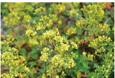
ハクサンオミナエシ (C・H)