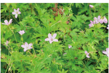
ハクサンフウロ (C・H)