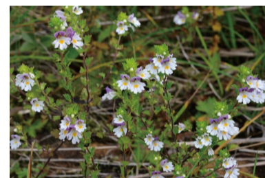
ミヤマコゴメグサ (D)