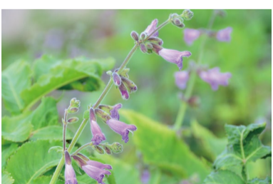
サルビア・サウパルマティネビス (G)