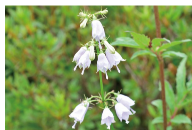
ハクサンシャジン (D・H)