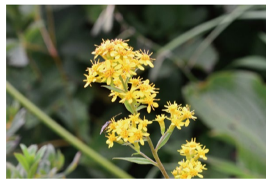
アキノキリンソウ (D・H)