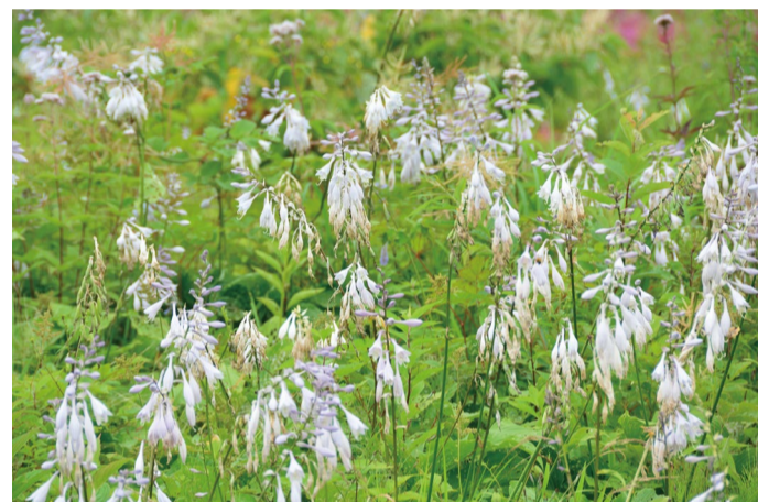
オオバギボウシ (C・H)