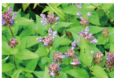
タテヤマウツボグサ (D)