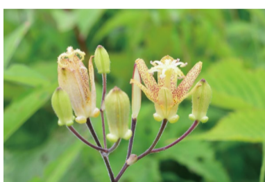
タマガワホトトギス (H)