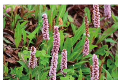
ヒマラヤトラノオ (G)