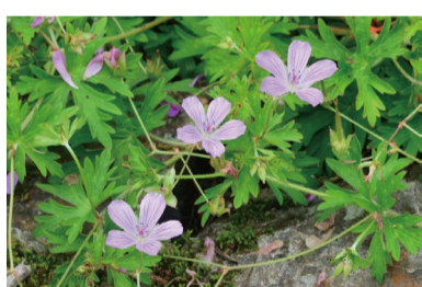
ハクサンフウロ (F・H)