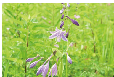
ハクサンシャジン (D)