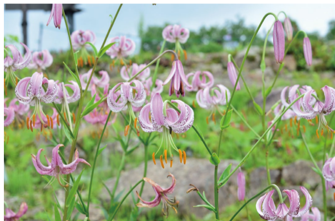
リリウム・ランコンゲンゼ (G)