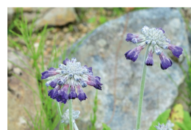
プリムラ・カピタータ (G)