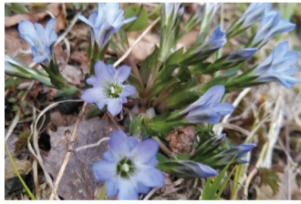
タテヤマリンドウ アルプス平自然遊歩道