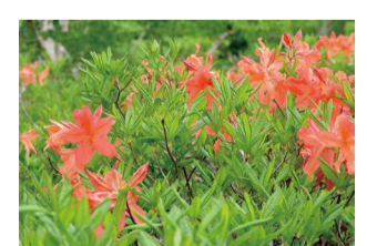
レンゲツツシ アルプス平自然遊歩道