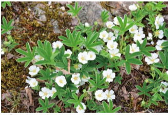
ポテンティラ・ニティダ