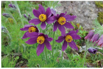
セイヨウオキナグサ