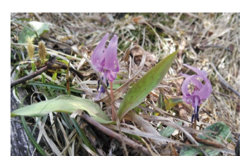
カタクリ アルプス平自然遊歩道

白馬五竜高山植物園は標高1515mの山の上にあります。麓のエスカルプラザからゴンドラ乗車で約8分。山の上の園内を楽に移動できるリフトも運行(6/25~10/10のみ) ※入園料はゴンドラ料金に含まれています。