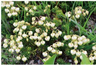
アオノツガザクラ