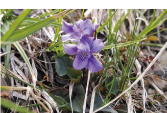
ミヤマナガハシスミシ アルプス平自然遊歩道