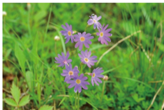
ハクサンコザクラ