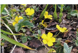
エチゴキジムシロ アルプス平自然遊歩道