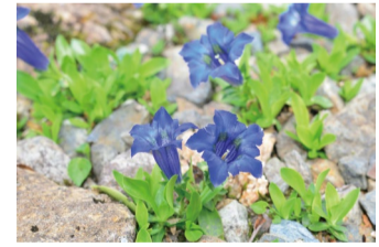
ゲンチアナ・ディナリカ