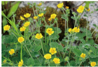
ウラジロキンバイ