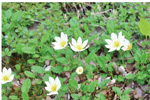
チョウノスケソウ