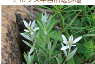
ハップウウスユキソウ アルプス平自然遊歩道