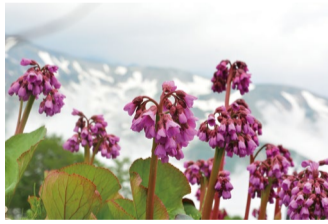
ベルゲニア・ブルブラセス