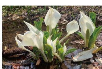
ミズバショウ アルプス平自然遊歩道