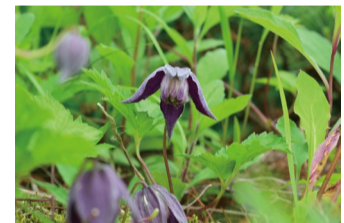
ミヤマハンショウツル