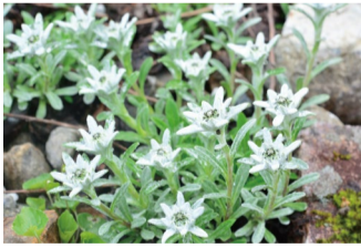
コウライウスユキソウ