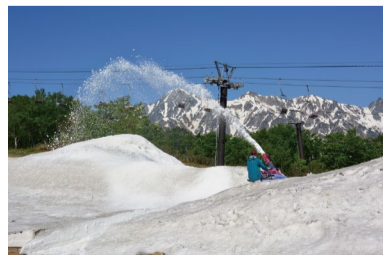
雪の切通し 残雪の間を通れる様に作りました。