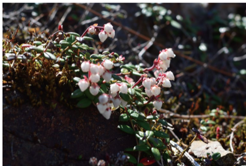
コメバツガザクラ