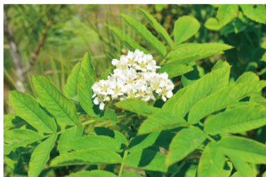
ウラジロナナカマド ハイマツ群落の中。