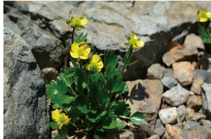
タカネキンポウゲ

ご来園の際は是非見ていただきたい小さな希少種。咲き始めました。週末が今年の見ごろでしょう。