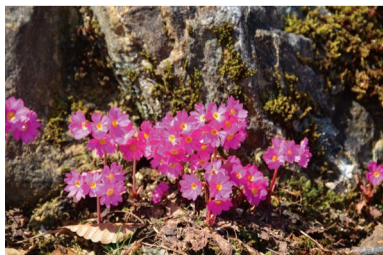
プリムラ・ロゼア ロックガーデンで見ごろです。