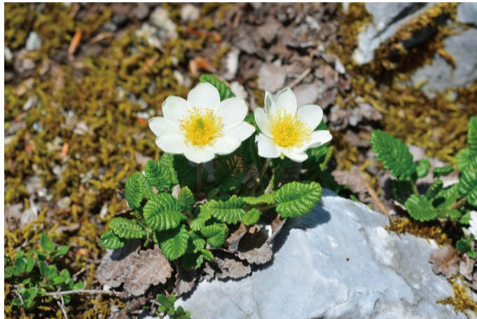
チョウノスケソウ

本州では白馬とハケ岳のみにみられる希少な高山植物。咲き始めました。ちょうど良い花が見られそうです。