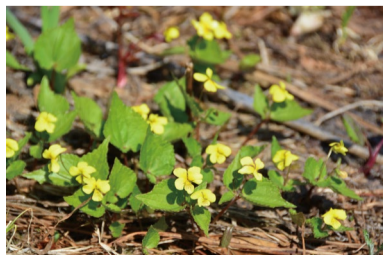
オオバクスミレ 咲き始め。