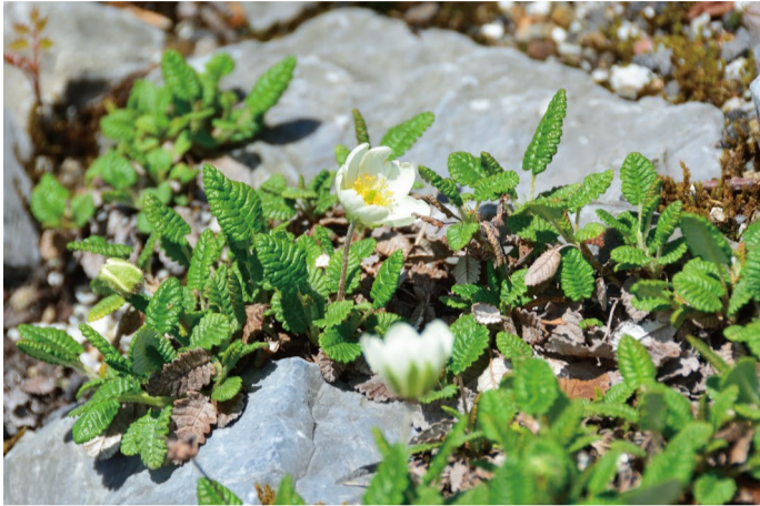
チョウノスケソウ

6/4・5、11・12、18・19は早期週末限定開園。園内全体的には雪解け直後で花数はとても少ないのですが、開花時期が早く例年の通常開園時には見ごろが終わってしまう事の多い貴重な高山植物を見ていただくために企画された特別開園となります。来週後半に発行予定の「開園直前号」と合わせて来園のご参考にご覧ください。当日は「学芸員とまわる植物園ツアー」も開催！