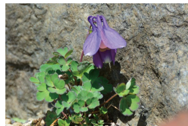
ミヤマオダマキ 咲きはじめ。