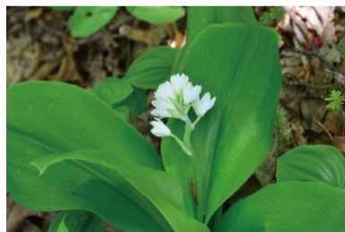
ツバメオモト 咲きはじめ。