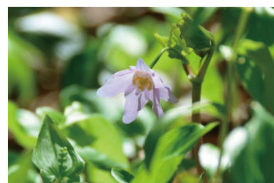
トガクシショウマ