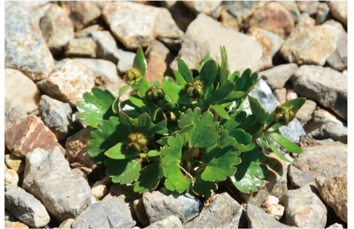
タカネキンポウゲ

なかなか見る事のできない高山植物です。順調に育っていて6/4・5には咲き始める見込み