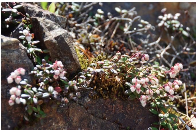
コメバツガザクラ

北アルプスをバックにした写真が簡単に撮れる人気区画で咲き始めました。見ごろになるでしょう。