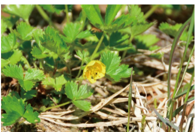
シナノキンバイ 咲きはじめ。

今回の限定開園のメインエリアとなるのは「白馬連峰高山植物生態園」ですが、その中にある岩場は小さな高山植物を間近で見ることが出来る人気スポットです。6/4・5の初回の週末では咲き始めと開花直前のこの3種が主役となりそうです。小さい花なので通り過ぎない様にご注意の上、近づいて良く見てください。