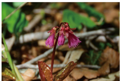
コイワカガミ 咲きはじめ。