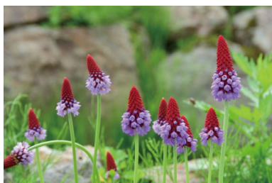
プリムラ・ピアリー (G)

※エリア記号について 植物名のあとにある記号は主に植えられている植物園内の各エリアを表しています。 (B)：アルプス平広場 (C)：草原の花 (D)：アルプス平自然遊歩道 (E)：高山の花 (F)：白馬連峰高山植物生態園 (G)：スイスアルプス・ヒマラヤ (H)：山の花