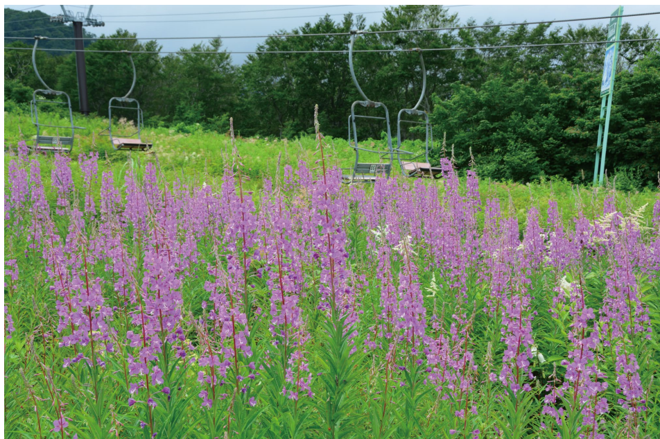
ヤナギランの群生 (C, H)