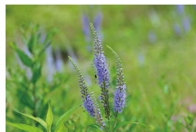
ヤマルリトラノオ (F, H)