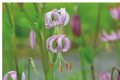
リリウム・ランコンゲンセ (C, G)