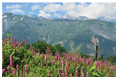
ヒマラヤトラノオ (G)