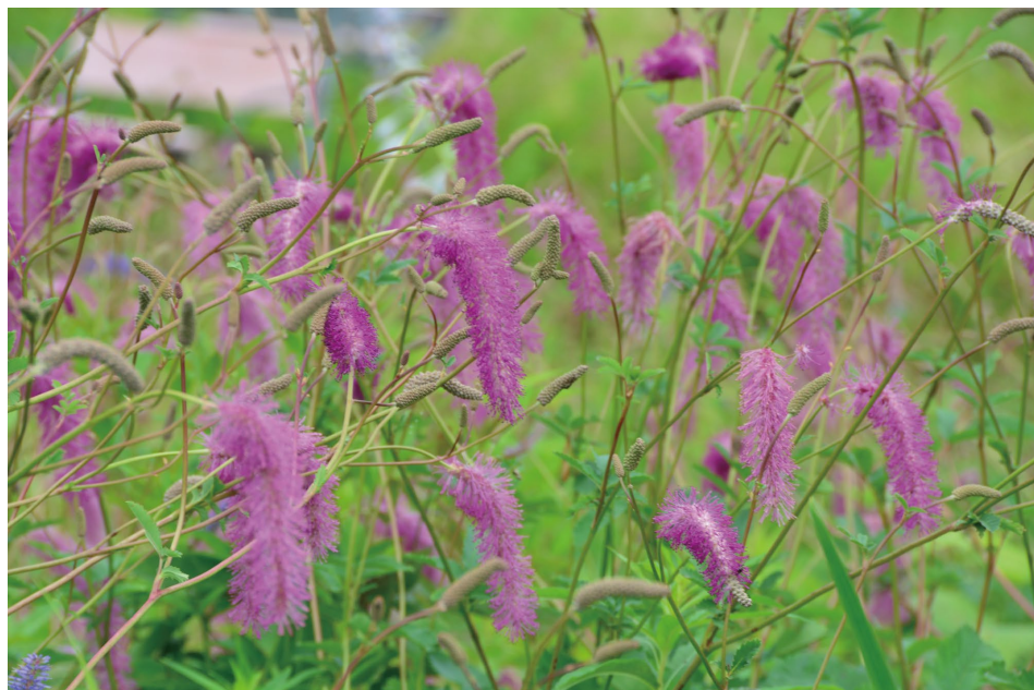
カライトソウの群生 (H)