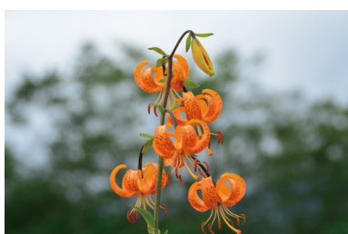
クマユリ (F, H)