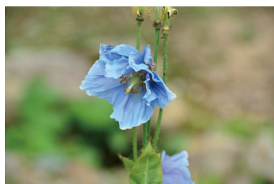
ヒマラヤの青いケシ (G, H)