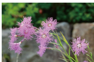
タカネナデシコ (E, H)