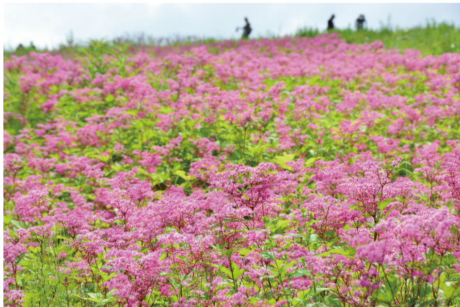
シモツケソウの群生 (H)