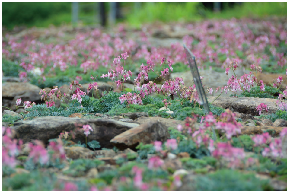
コマクサの大群生 (E)

真夏の園内は赤く染まります！園内 12 万株のコマクサの大群生は不動のヒロイン！遠くからでも鮮やかに見える赤い群生はシモツケソウ、ヤナギラン、カライトソウなど。それぞれの赤色の違いをお楽しみいただけます。記念撮影スポットもお見逃しなく。8/7(土)～14(土)は夏休み特別イベントが昼間の植物園と期間中は毎日運行のナイトゴンドラでそれぞれ開催！