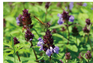
タテヤマウツボグサ (D、H)