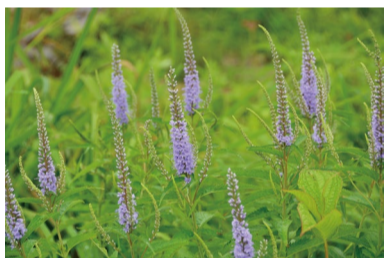
ヤマルリトラノオ (F)