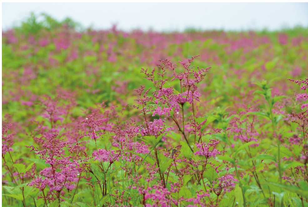
山の花エリアの「シモツケソウ」の群生 (D・H)