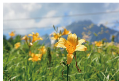
ニッコウキスゲ (D・H)