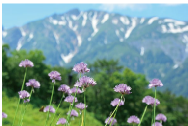
シロウマアサツキ (F)