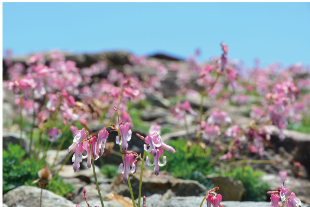
園内に12万株ある「コマクサ」の大群生が見ごろ (E)

見ごろが続くコマクサはメインの植生地「コマクサ通り」で100m続く歩道の両側で大群生が見られます。また、シモツケソウの群生も赤く染まり見ごろ。ヤナギランや人気のエーデルワイスなど夏の花が見ごろになってきました。