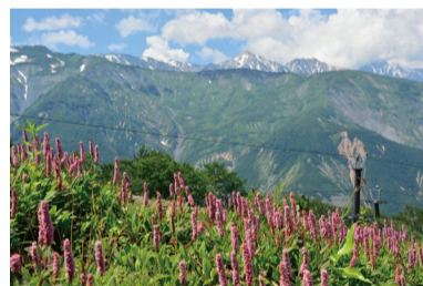
ヒマラヤ・トラノオ (G)