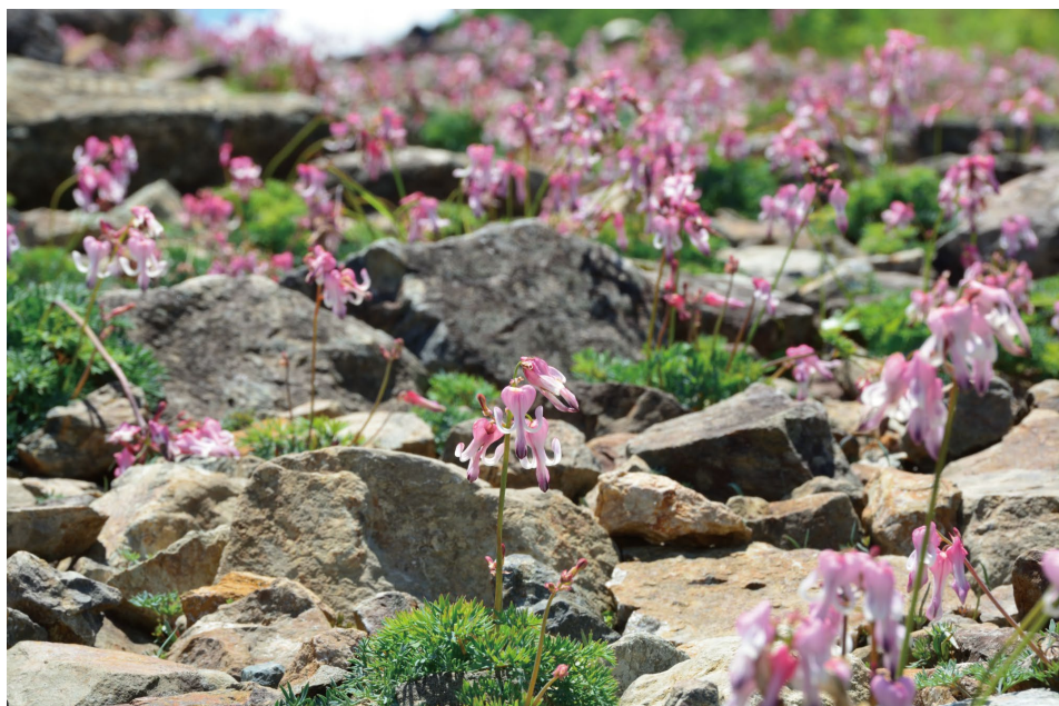
園内で12万株ある「コマクサ」の大群生 (E)

園内に約12万株あるコマクサが、コマクサ通りと呼ばれるメイン区画の100m程ある歩道の両脇で大群生でとても見ごろ！ ニッコウキスゲやヒオウギアヤメの群生も見ごろ。アルプス平自然遊歩道の散策もおすすめ！ ヒマラヤの青いケシ開花中です！