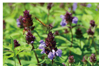
タテヤマウツボグサ (D, H)