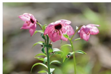
ノモカリス・フォレストイ (G)