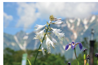
オオバギボウシ (C, H)