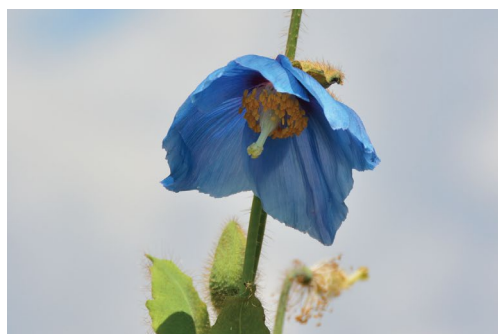
ヒマラヤの青いケシ (G, H)