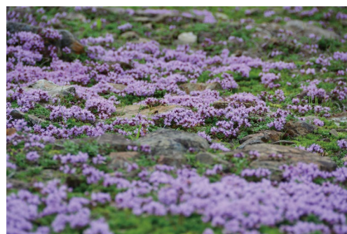
イブキジャコウソウ (E)