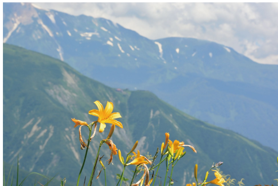
ニッコウキスゲ (D, H)