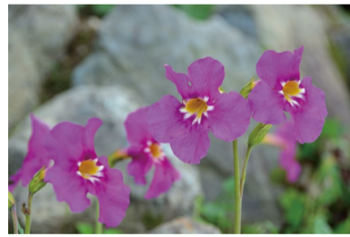
インカルピレア・ソンドリアネンシス (G)