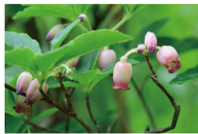
ウラジロヨウラク (D)