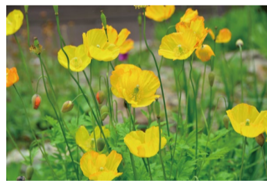
メコノプシス・カンブリカ (B, G)