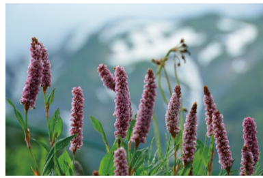
ヒマラヤトラノオ (G)