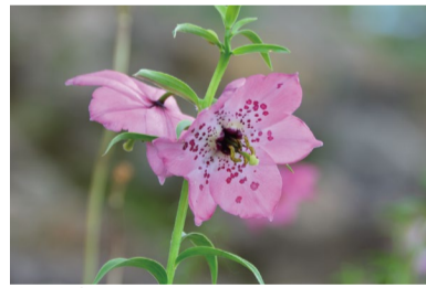
ノモカリス・フォレストイ (G)