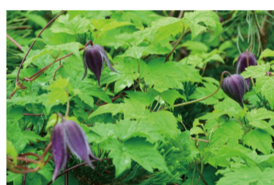
ミヤマハンショウツル (F)