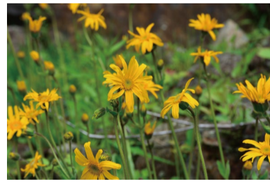
アルニカ・モンタナ (G)