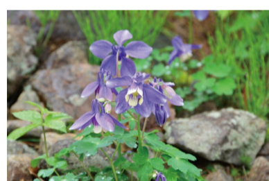
ミヤマオダマキ (E, H)