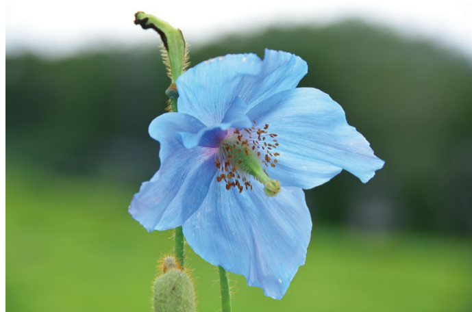
ヒマラヤの青いケシ (B, G)

約12万株あるコマクサがどんどん開花していてメインの区画で大群生が見られます。ヒマラヤの青いケシも開花数が増えて見ごろになってきました。園内全体で開花する高山植物の種類が増え、色々な花が見られるとても賑やかな季節になりました。