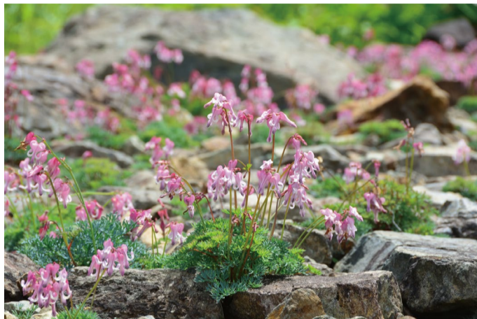
コマクサの大群生 (E, F)