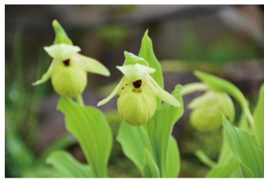
中国のアツモリソウ (B)