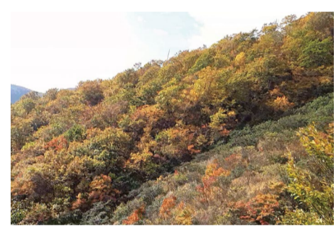
ゴンドラ"テレキャビン"乗車中

山頂レストラン「あるぷす 360」アルプス展望ペアリフトの夏季営業は終了しました。