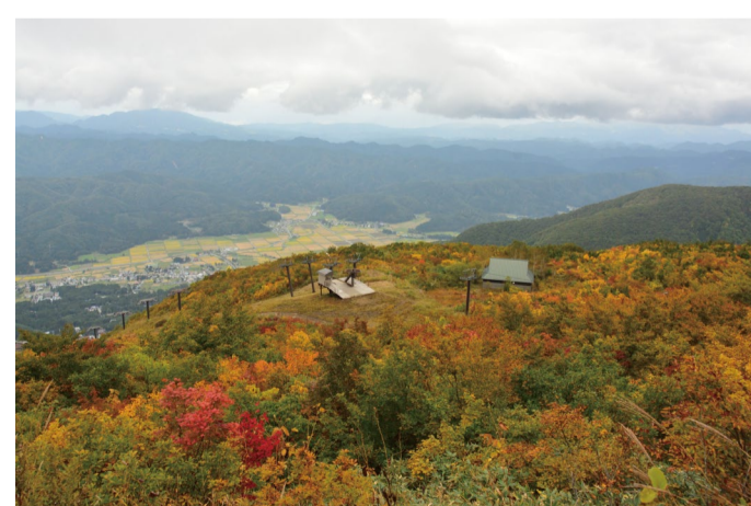
10/6の地蔵ケルンより見おろす景色