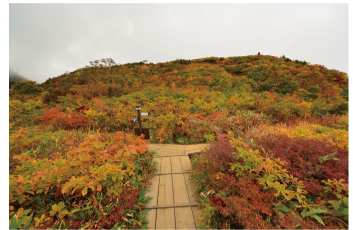
10/6のアルプス平自然遊歩道の様子

標高 1620m のアルプス展望ペアリフト 終点付近から、1670m の地蔵ケルンに かけての「アルプス平自然遊歩道」で 紅葉が見ごろに入りました。 気軽に散策できるこのルートは、 10/10(土)、11(日)の週末にとっても良い 見ごろになりそうで特におススメです。 また、ここから標高 2000m の 小遠見山山頂へのトレッキングルート でも紅葉が楽しめそうです。