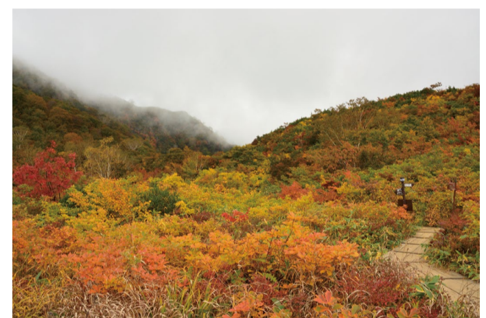
10/6のアルプス平自然遊歩道の様子

【白馬五竜高山植物園】 上の方で色づき始め。 園内ではマツムシソウなど 秋の花がチラホラ見られます。