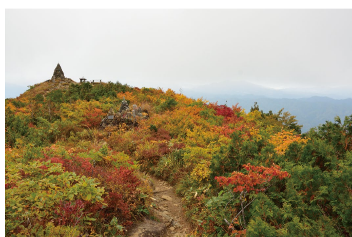
10/6、地蔵ケルンを見上げて