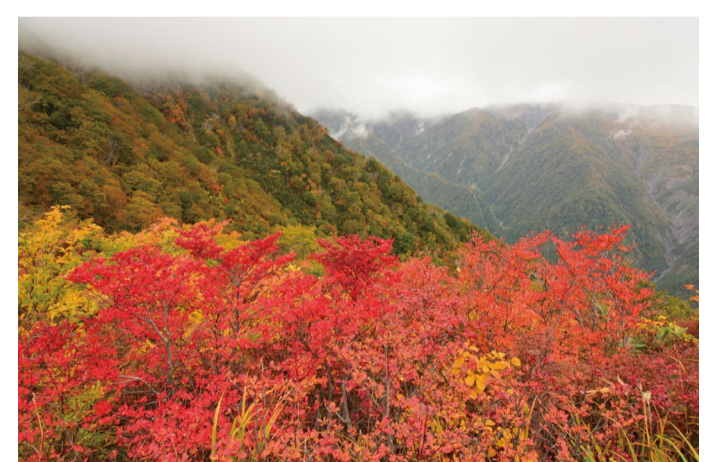
10/6のアルプス平自然遊歩道の様子

※白馬五竜の紅葉は場所ごとの標高差により時期に差が出るため、アルプス平自然遊歩道や小遠見山トレッキングルートを含めた全体が一度に紅葉する事はありません。またその時期の気候によっても都度進み具合に差がでてきます。今年の紅葉は10/6現在、例年より1週間程遅れている印象です。