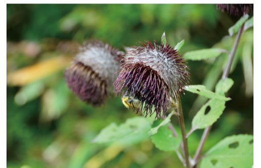
オヤマボクチ (アルプス平自然遊歩道)