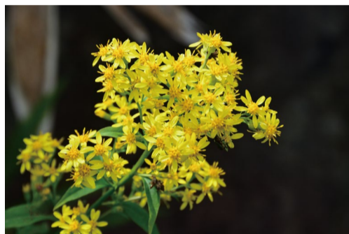
アキノキリンソウ