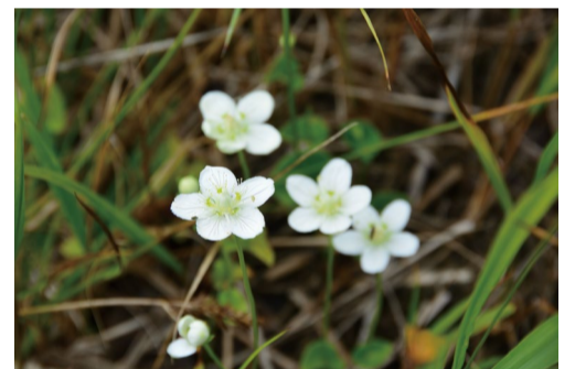
コウメバチソウ (アルプス平自然遊歩道)