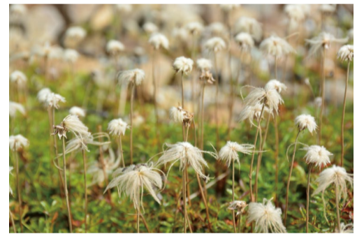
チングルマの綿毛