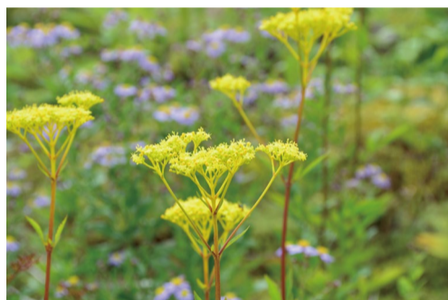
ハクサンオミナエシ