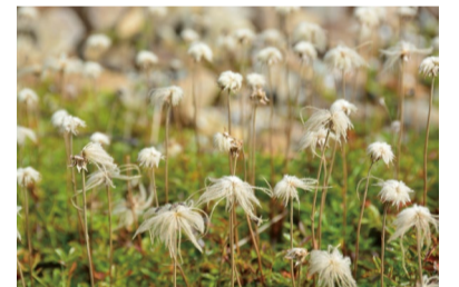
チングルマの綿毛