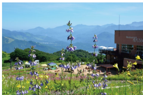
ツリガネニンジン