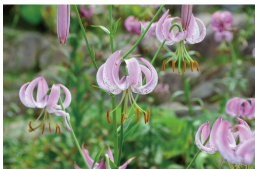
リリウム・ランコンゲンセ