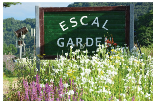
エスカルガーデン (ベースセンター・エスカルプラザ前の無料エリア)