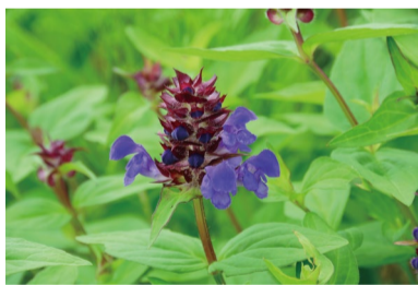
タテヤマウツボグサ