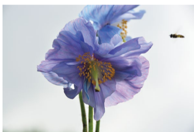
ヒマラヤの青いケシ