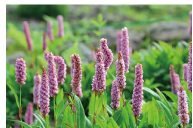
ヒマラヤトラノオ