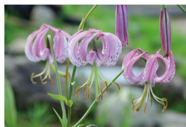
リリウム・ランコンゲンセ