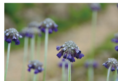
プリムラ・カピタータ