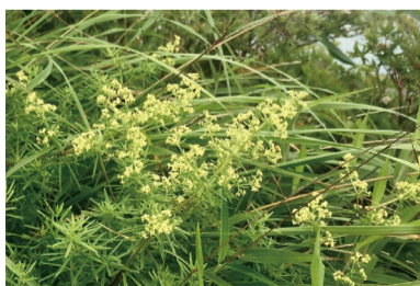
キバナカワラマツバ