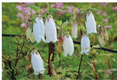
ヤマホタルブクロ