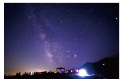
8/8～15はナイトゴンドラ

●8人乗りゴンドラ「五竜テレキャビン」 営業日 6月13日～10月25日 営業時間 8:15～16:00(下り最終16:30) 往復料金 大人2,000円 小人1,000円