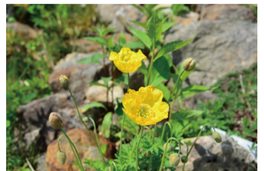
メコノプシス・カンブリカ