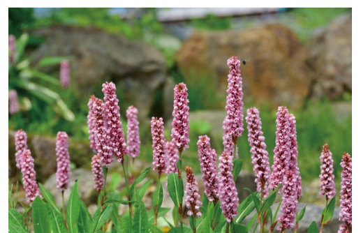
ヒマラヤトラノオ

●8人乗りゴンドラ「五竜テレキャビン」 営業日 6月13日～10月25日 営業時間 8：15～16：00(下り最終16：30) 往復料金 大人2,000円 小人1,000円