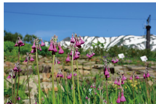
プリムラ・セクンディフロラ