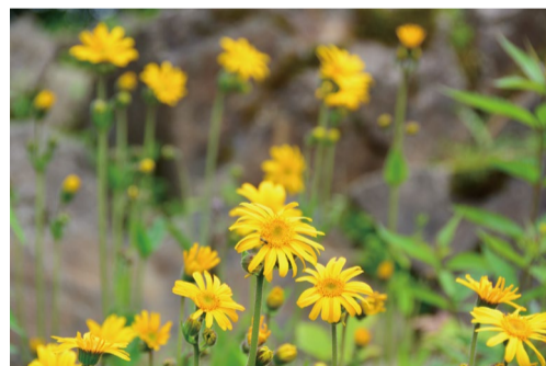
アルニカ・モンタナ