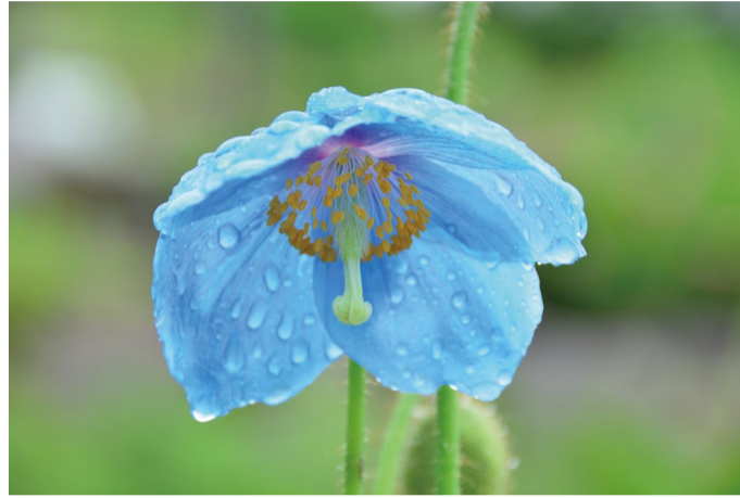
ヒマラヤの青いケシ