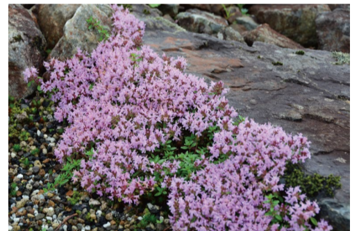
イブキジャコウソウ