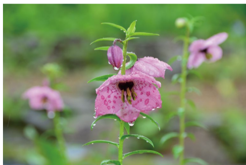
ノモカリス・フォレストィ