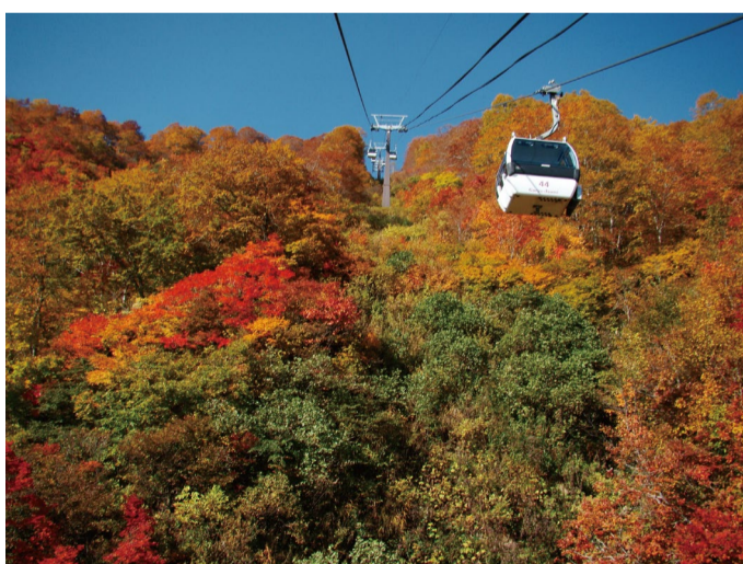
ゴンドラ乗車中の紅葉(10月上旬~中旬)

●8人乗りゴンドラ「テレキャビン」 営業日 6月15日~10月27日 営業時間 8:15~16:00(下り最終16:30) 往復料金 大人1800円 小人900円