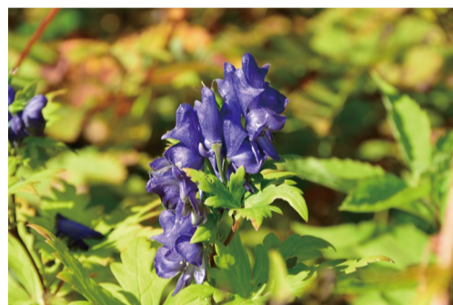
ミヤマトリカブト