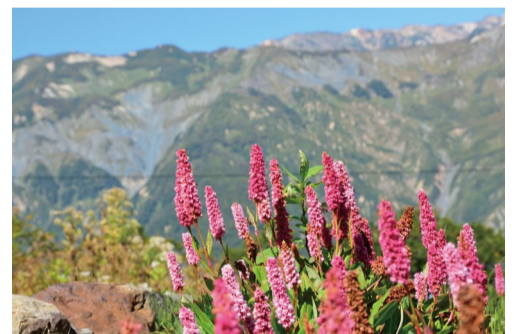
ヒマラヤトラノオ