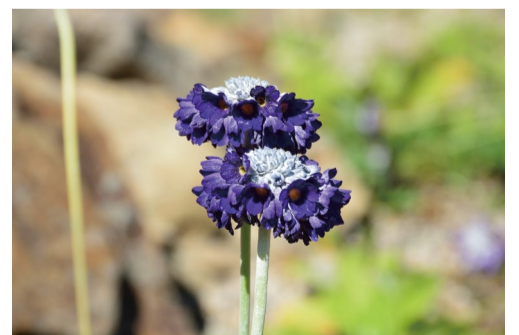
プリムラ・カピタータ