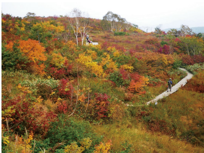
アルプス平自然遊歩道の紅葉(9月下旬~10月上旬)