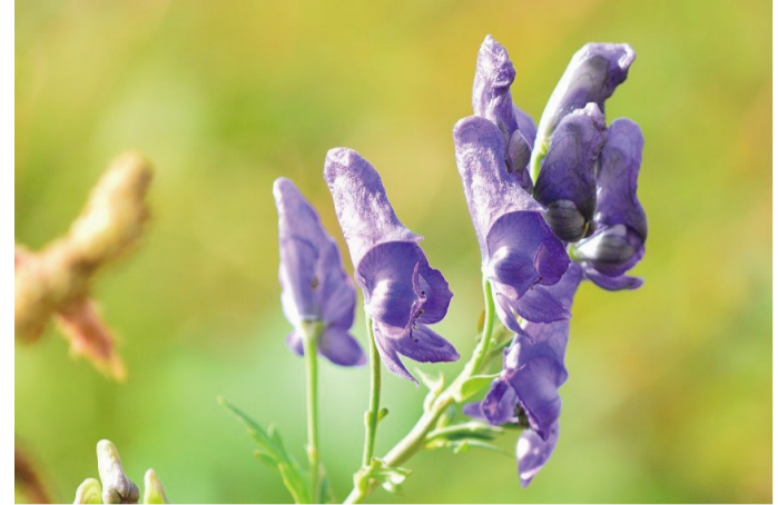
ミヤマトリカブト