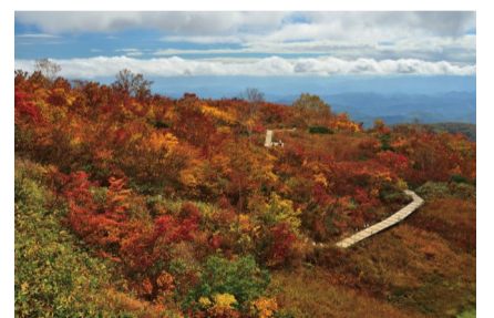
アルプス平自然遊歩道