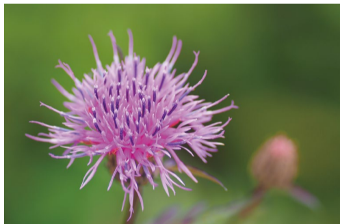
タムラソウ (アルプス平自然遊歩道)