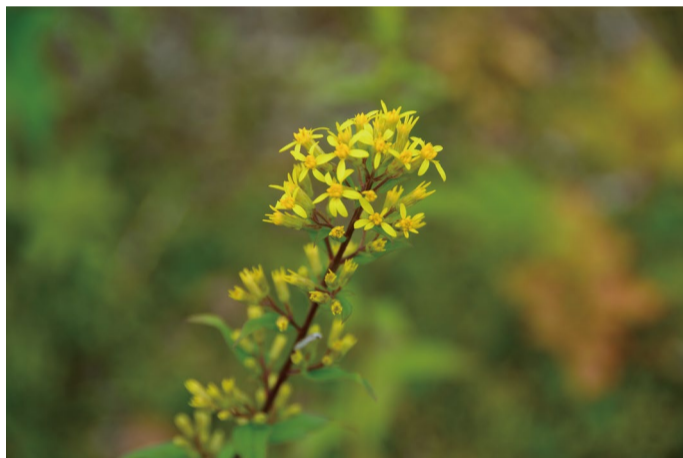
アキノキリンソウ