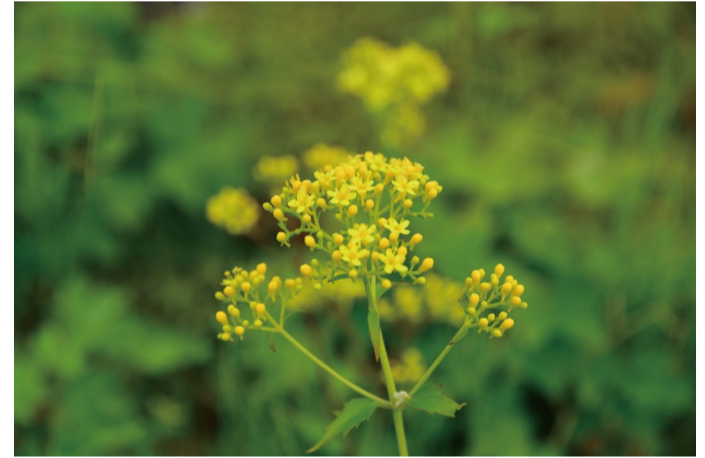
ハクサンオミナエシ