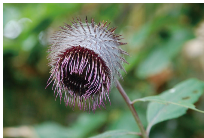
オヤマボクチ (アルプス平自然遊歩道)