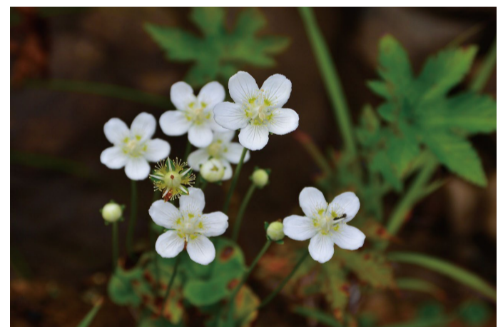
コウメバチソウ (アルプス平自然遊歩道)