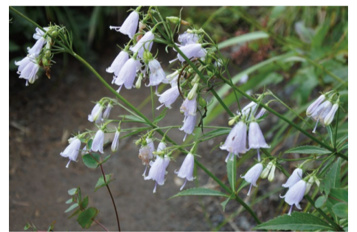
ハクサンシャジン (アルプス平自然遊歩道)