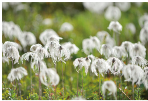
チングルマの綿毛