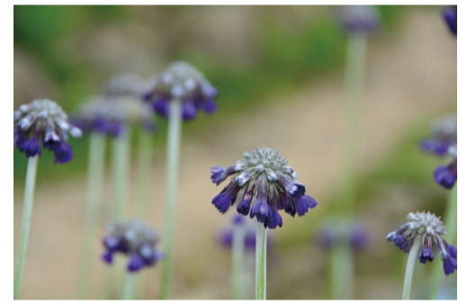
プリムラカピタータ