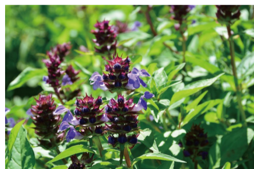
タテヤマウツボグサ