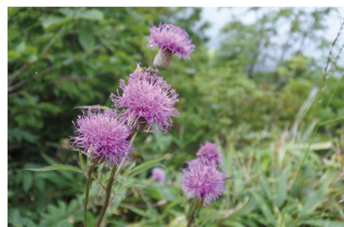
タムラソウ (アルプス平自然遊歩道)

●8人乗りゴンドラ「テレキャビン」 営業日 6月15日～10月27日 営業時間 8:15～16:00(下り最終16:30) 往復料金 大人1800円 小人900円