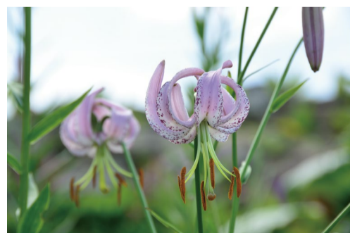
リリウム・ランコンゲンセ