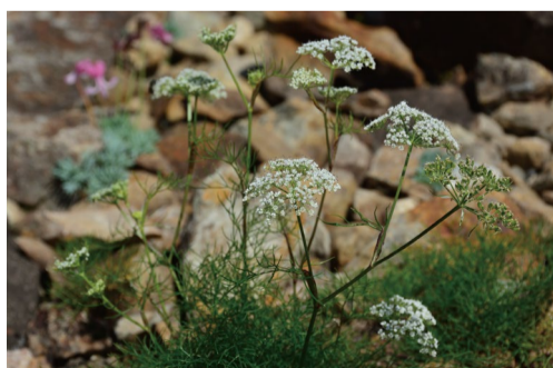
ミヤマウイキョウ