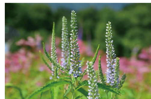
ヤマルリトラノオ