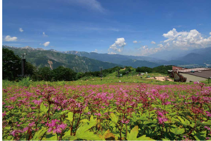
シモツケソウの群生