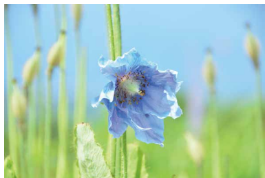
ヒマラヤの青いケシ (まだ少し見れます)