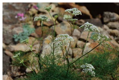
ミヤマウイキョウ