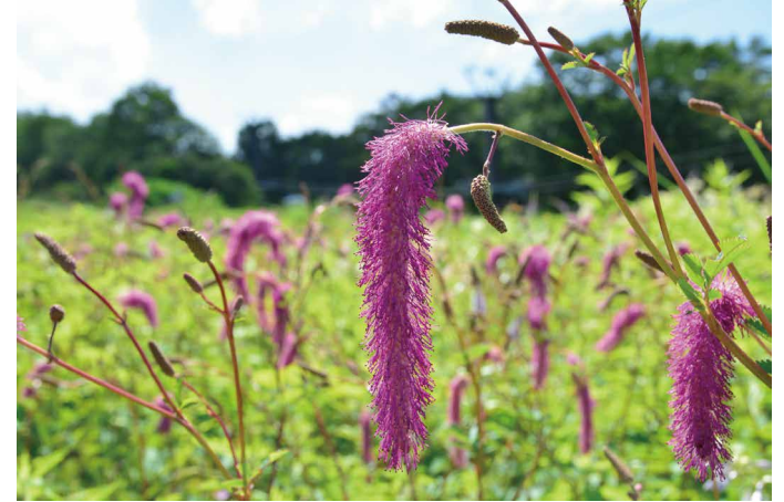
カライトソウの群生