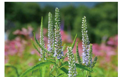
ヤマルリトラノオ