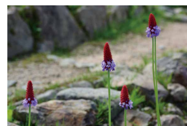
プリムラ・ピアリー