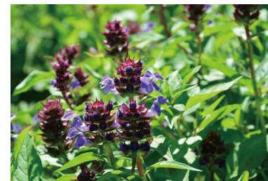
タテヤマウツボグサ