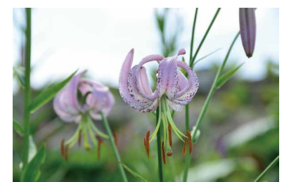
リリウム・ランコンゲンゼ