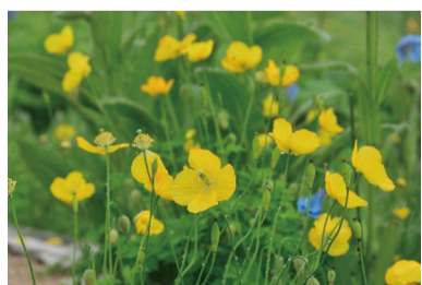
メコノプシス・カンブリカ