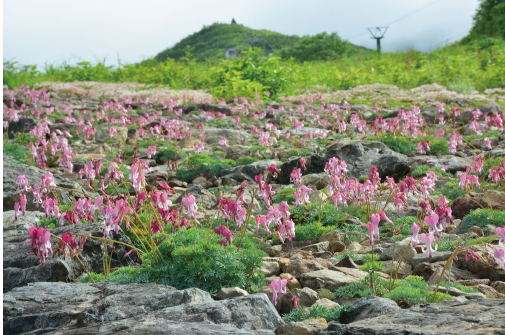
100m 程続くコマクサの大群生は必見です。

ヒマラヤの青いケシとコマクサの群生は見どころです。それに加えてエーデルワイスなどの夏の花々もいろいろと咲き始めています。女性に大人気のササユリも咲きました。