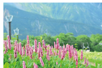
ヒマラヤトラノオ