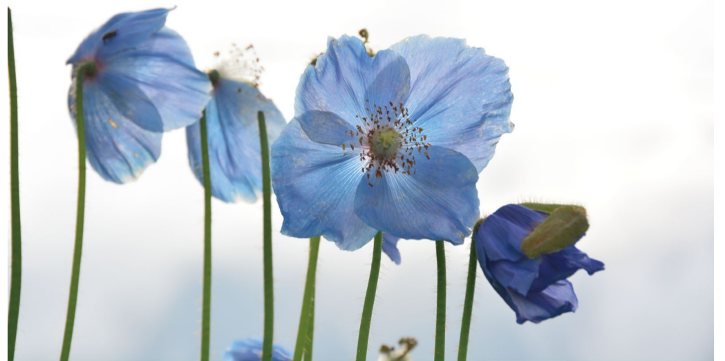
幻の花「ヒマラヤの青いケシ」まだまだ咲いています。