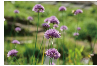
シロウマアサツキ