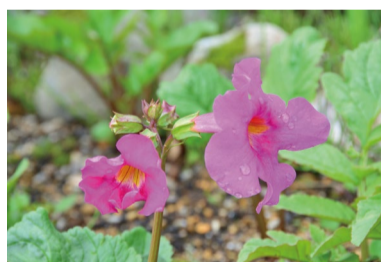
インカルビレア・ ゾンディアネンシス