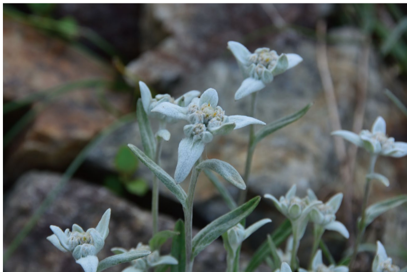
エーデルワイス (スイスアルプス・ヒマラヤエリアで咲いています。)