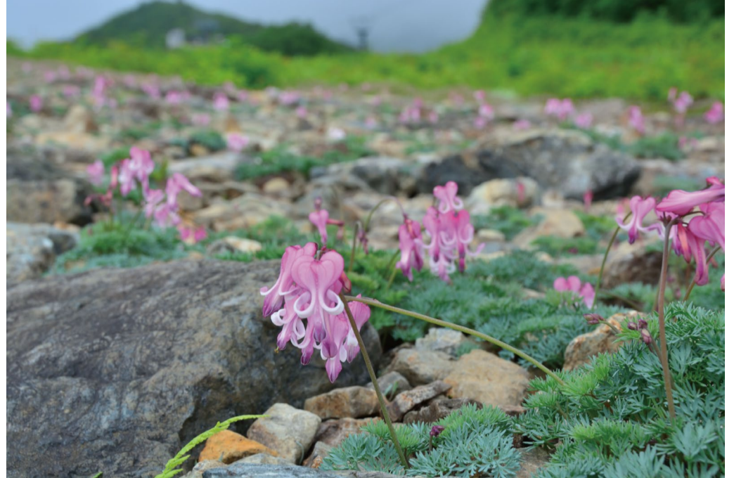
見ごろの続くコマクサの大群生