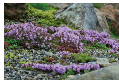
イブキジャコウソウ