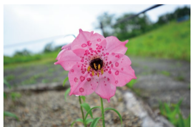
ノモカリス・フォレストイ