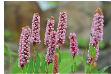
ヒマラヤトラノオ