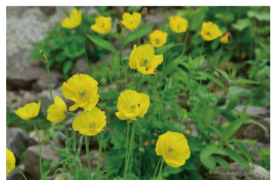
メコノプシス・カンブリカ