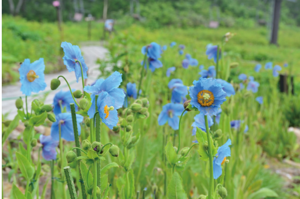
見ごろとなった「ヒマラヤの青いケシ」

ヒマラヤの青いケシはヒマラヤエリアとアルプス平広場で大量開花し見ごろになっています。 コマクサの大群生は引き続き大変見ごろ、アルプス平広場下ではヒオウギアヤメが群生になりました。