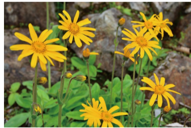
アルニカ・モンタナ