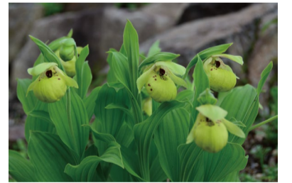
中国のアツモリソウ