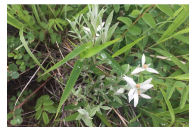
ハッポウウスユキソウ