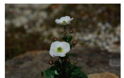
ウメバチキンポウゲ

●8人乗りゴンドラ「テレキャビン」 営業日 6月15日～10月27日 営業時間 8:15～16:00(下り最終16:30) 往復料金 大人1800円 小人900円