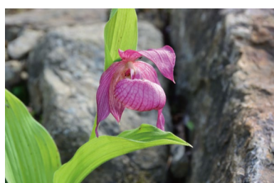
中国のアツモリソウ