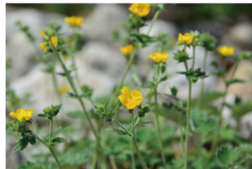
ウラジロキンバイ