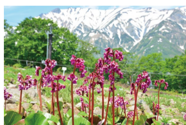
ヒマラヤユキノシタ