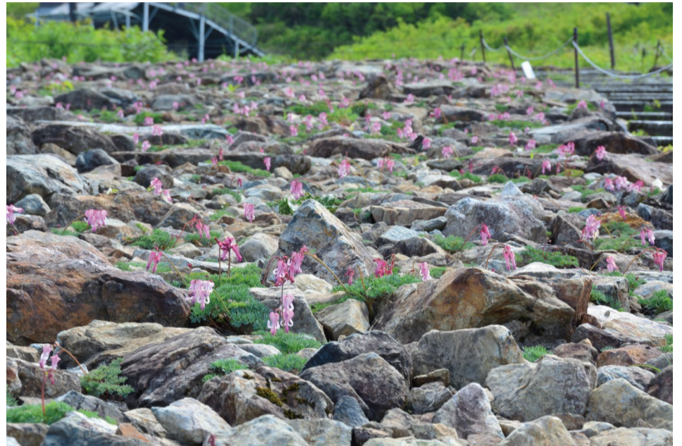
コマクサ群生地上部の様子