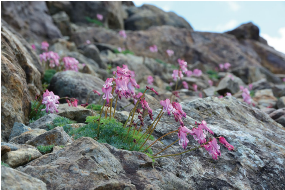
群生が見ごろのコマクサ

コマクサ群生地の上部を中心にコマクサが次々と開花し群生が見ごろとなりました。付近ではウルップソウもまだ見られ、園内の花の種類も増えてきて賑やかになっています。ヒマラヤの青いケシはツボミが目立つようになりまもなく花が増えはじめそうです。