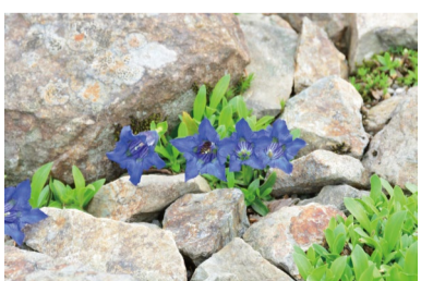
ゲンチアナ・ディナリカ