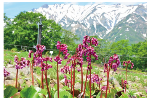
ヒマラヤユキノシタ