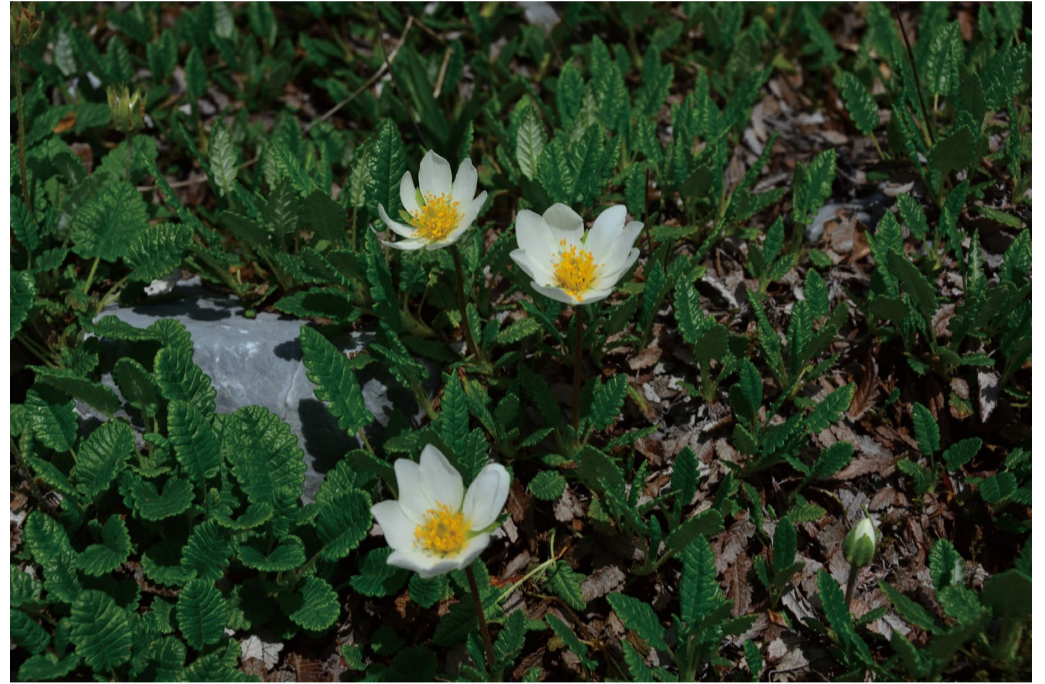
チョウノスケソウ。まだ間に合います。