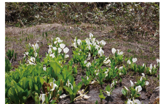
ミズバショウ (アルプス平自然遊歩道)

●8人乗りゴンドラ「テレキャビン」 営業日 6月15日～10月27日 営業時間 8：15～16：00(下り最終16：30) 往復料金 大人1800円 小人900円