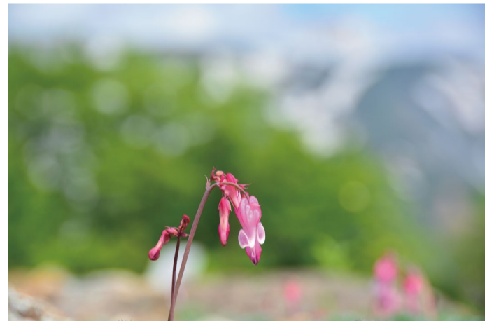
コマクサは次々と咲き始めています