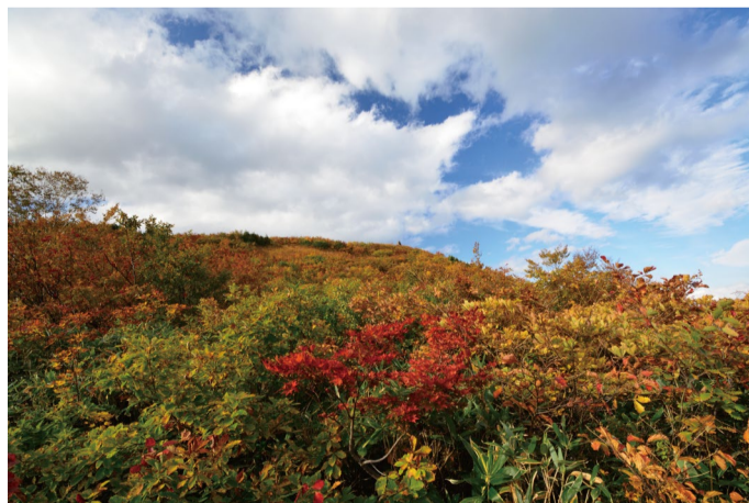
地蔵ケルンを見上げて