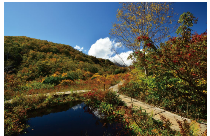
アルプス平自然遊歩道

●8人乗りゴンドラ「テレキャビン」 営業日 6月16日～10月28日 営業時間 8:15～16:00(下り最終16:30) 往復料金 大人1800円 小人900円