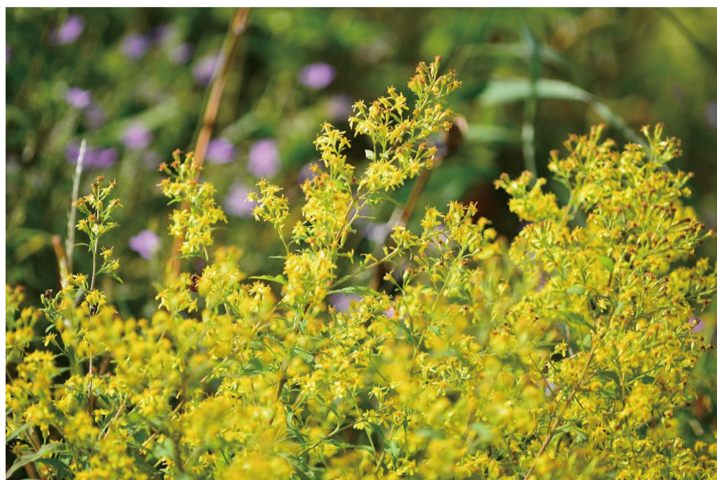
アキノキリンソウ