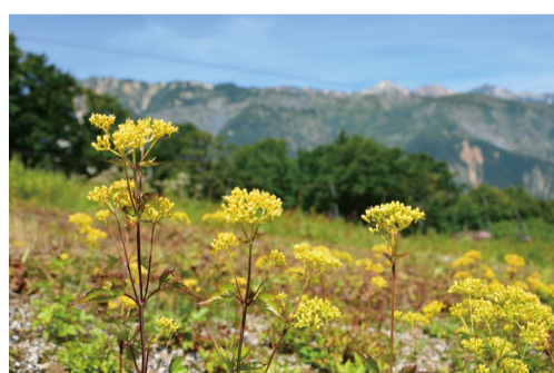
ハクサンオミナエシ