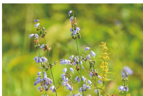
ツリガネニンジン