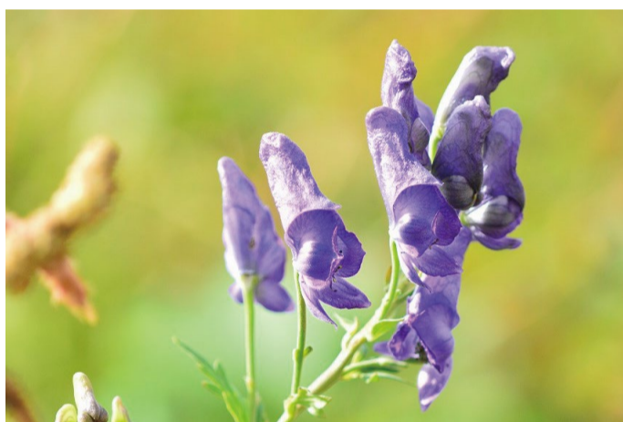
ミヤマトリカブト