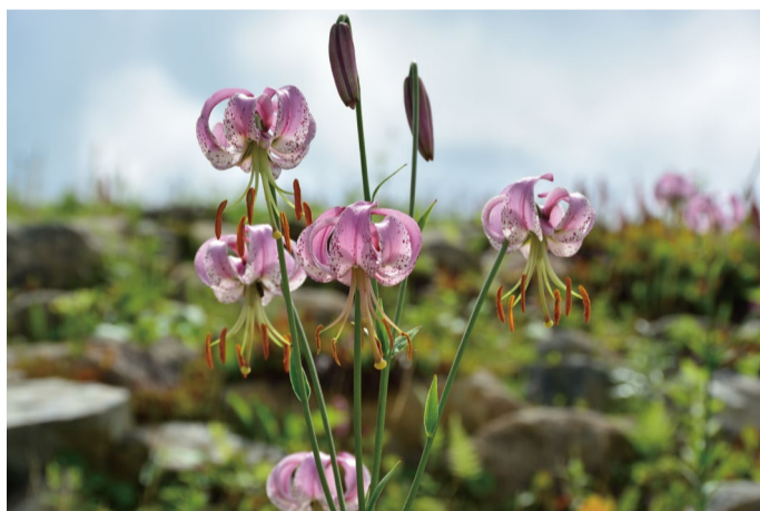
リリウム・ランコンゲンゼ