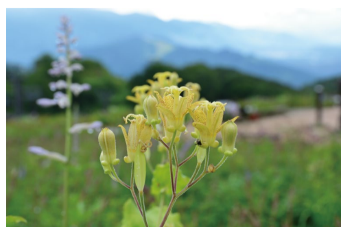
タマガワホトトギス