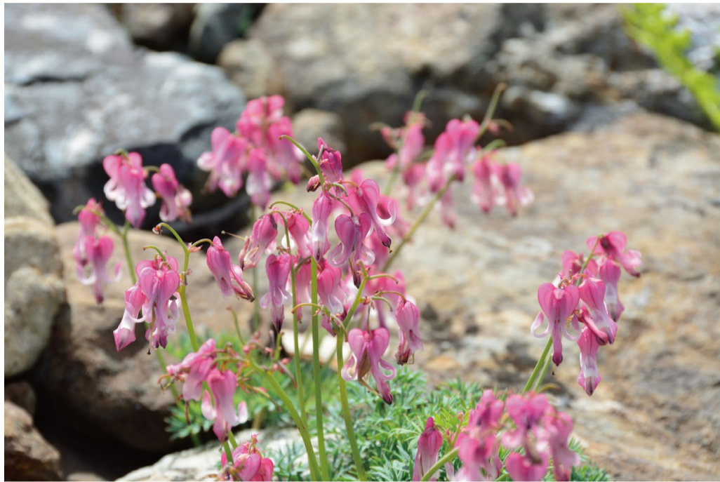
コマクサはまだまだ見られます。

8月に入り”シモツケソウ”や”ヤナギラン”、カライトソウなどが見ごろです。高山植物の女王”コマクサ”の群生や”エーデルワイス”も人気です。