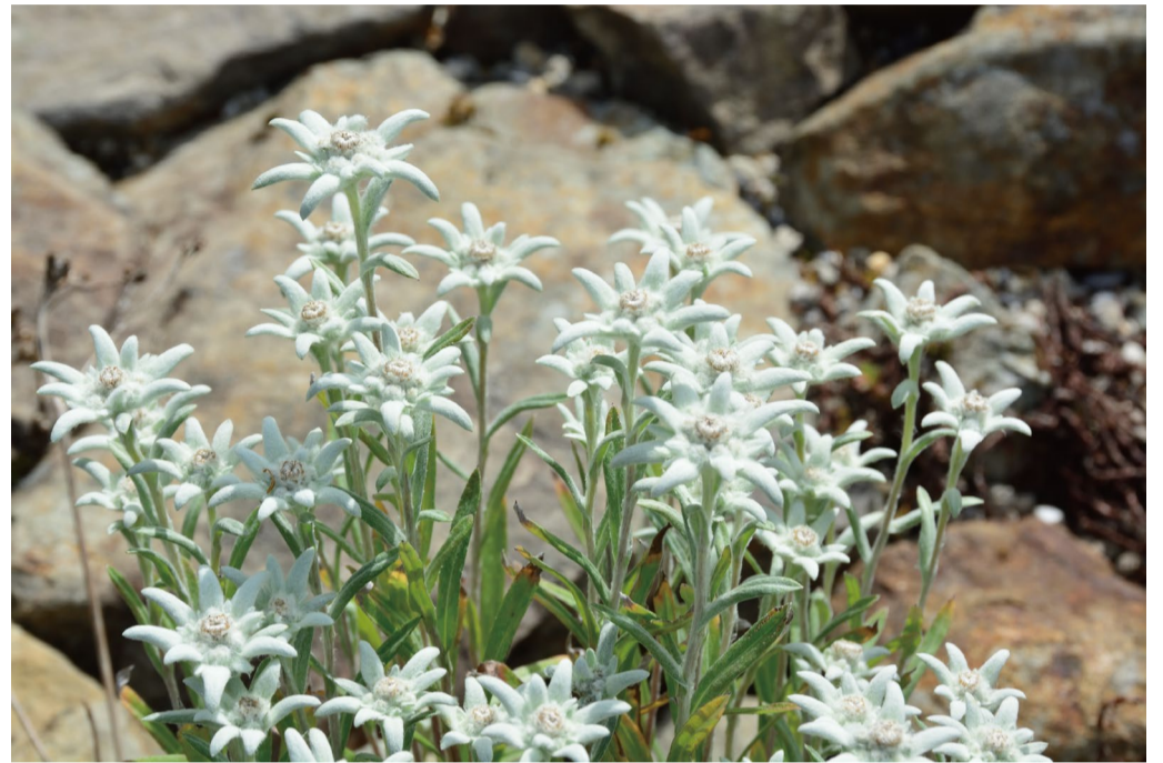
みんなが歌うエーデルワイス。