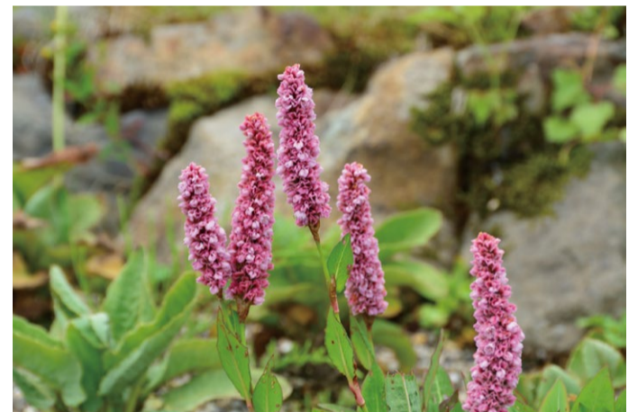
ポリゴナム・アフィネ(ヒマラヤトラノオ)