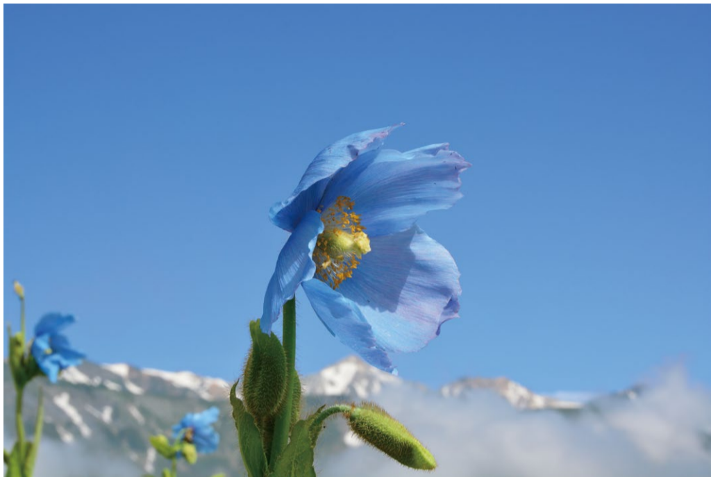
ヒマラヤの青いケシ。

高山植物の女王”コマクサ”の群生や”ヒマラヤの青いケシ”などが人気です。 ”シモツケソウ”や”ヤナギラン”など夏の花も咲き始めて花の種類が多い時期になりました。