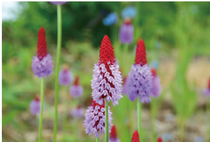
プリムラ・ヴィアリー