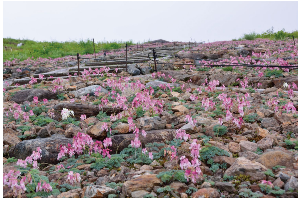
コマクサの群生、見ごろです。