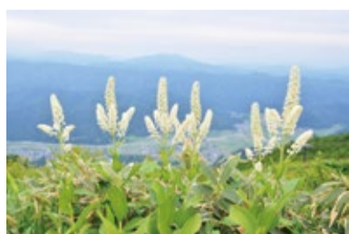
コバイケイソウ ※今年は当たり年です