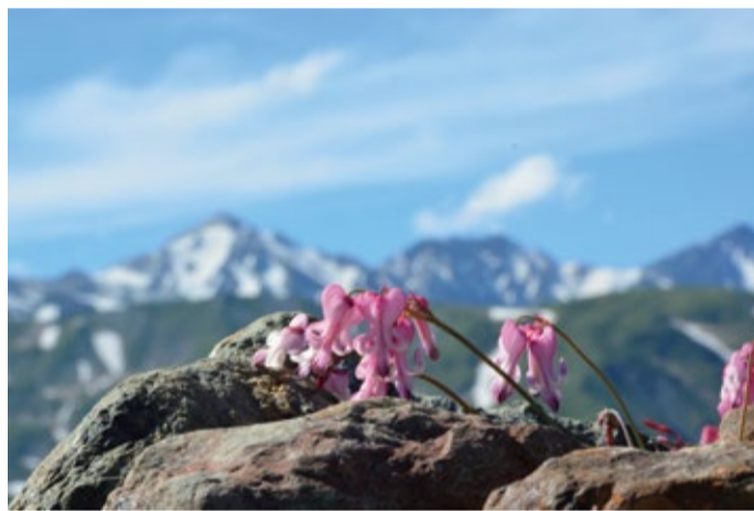
コマクサは上部で見ごろ