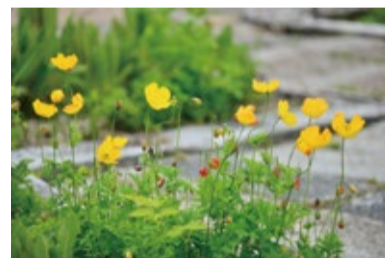
メコノプシス・カンブリカ