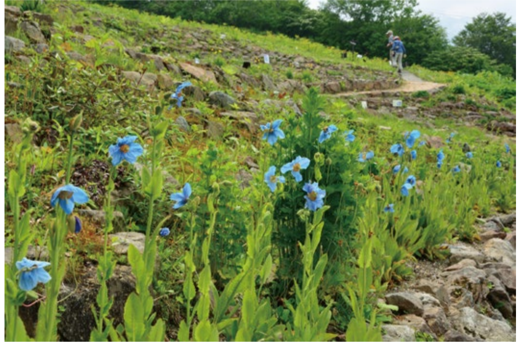
ロックガーデンの一角ではどんどん花が増えていきます