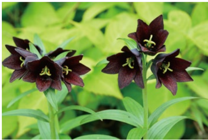
入口広場のクロユリは見ごろ