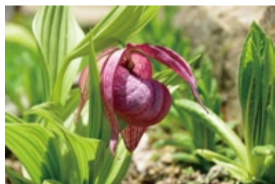
中国のアツモリソウ