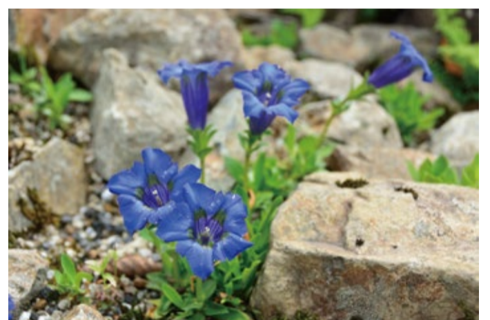
スイス3大名花「ゲンチアナディナリカ」