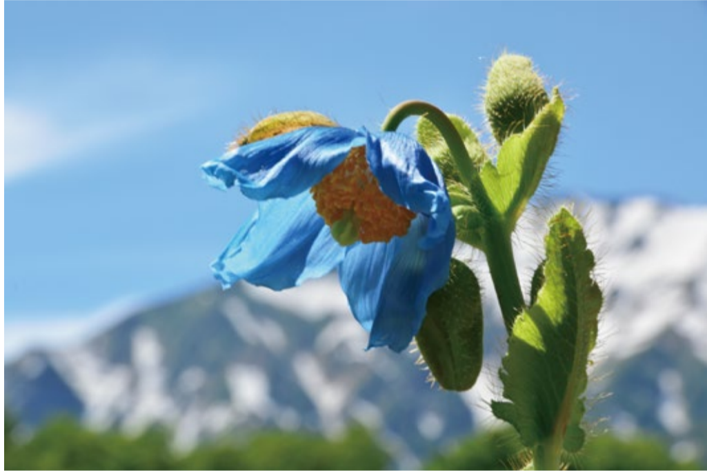
ヒマラヤの青いケシ。

今年の「ヒマラヤの青いケシ」は開花が早めに進んでいます。ロックガーデンではまとまって30以上の開花が見られる場所もあり見頃です。コマクサの花も増えていて上部では見ごろ。