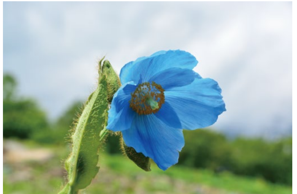
ヒマラヤの青いケシ。6/19に2つ目が咲きました。