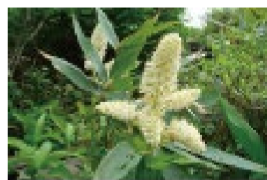
コバイケイソウ ※今年は当たり年です