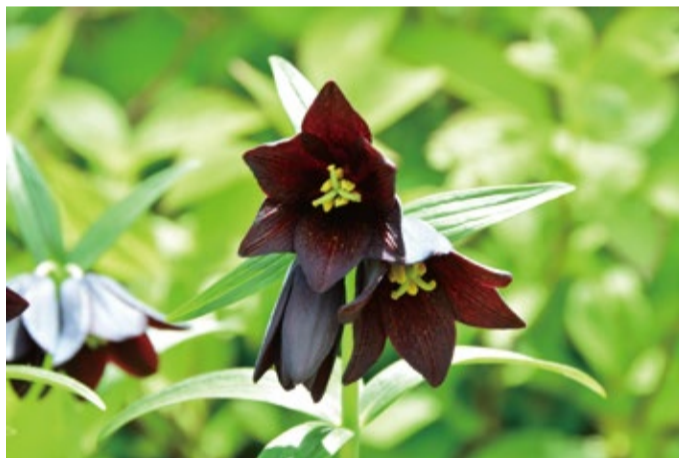
入口広場のクロユリは咲き始め