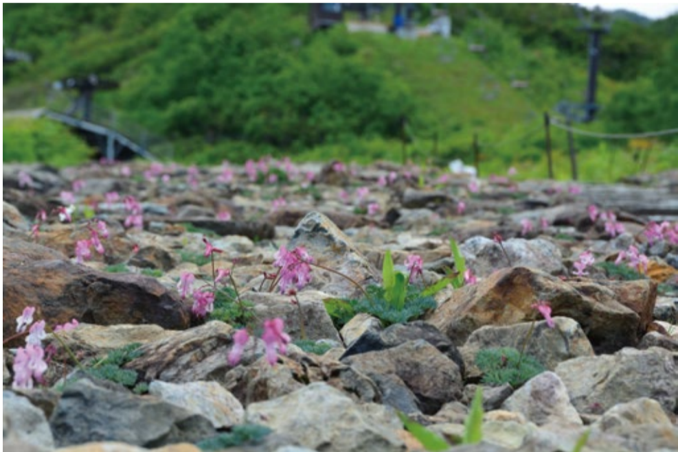
コマクサ通り最上部では群生も見られます。

園内上部ではコマクサが一部見ごろとなっている他、チングルマやシラネアオイなども見頃、クロユリや中国のアツモリソウが咲き始めています。ヒマラヤの青いケシも開き始めました。また、アルプス平自然遊歩道ではコバイケイソウが咲きミスバショウ等と合わせて見頃です。