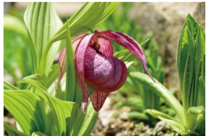
次々と開花する中国のアツモリソウ