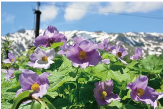
入口広場付近のシラネアオイ