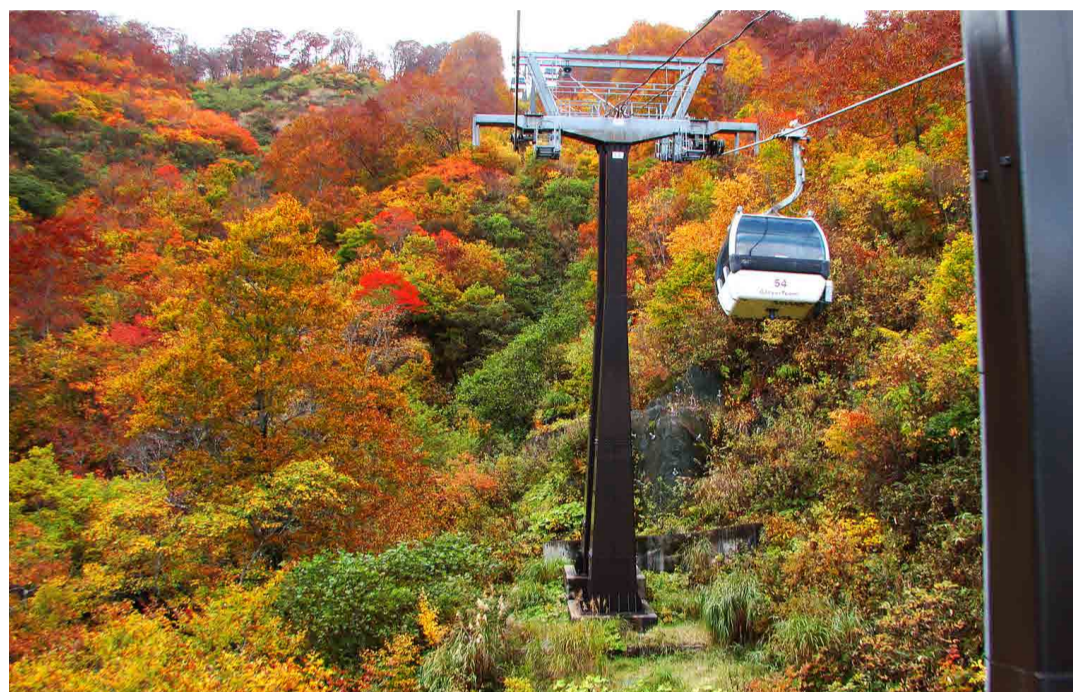
ゴンドラテレキャビン山頂付近