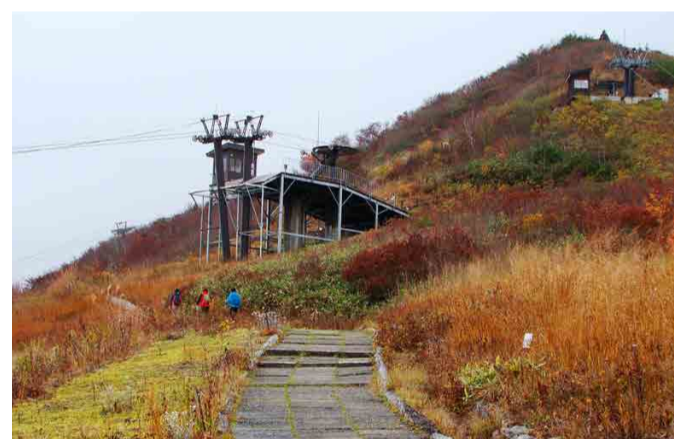
植物園から遊歩道へ