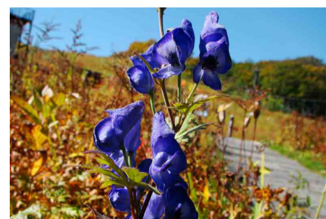
ミヤマトリカブト