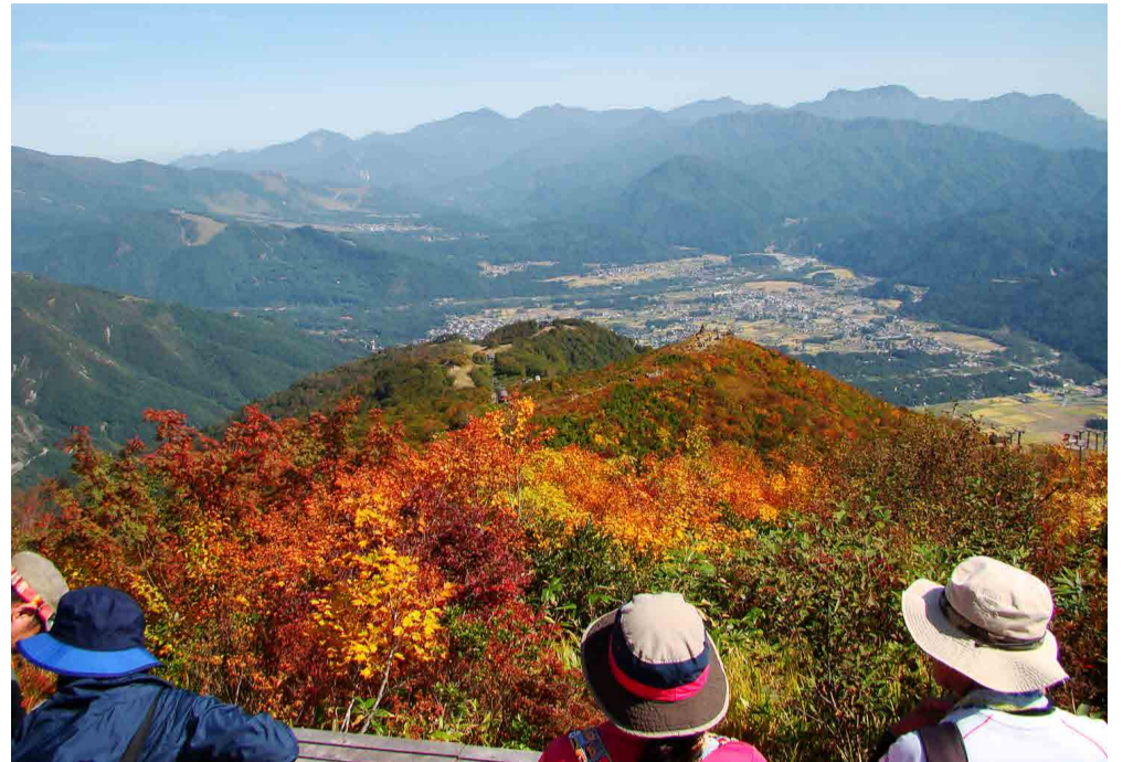
小遠見山トレッキングコースの見返り坂より