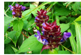
タテヤマウツボグサ