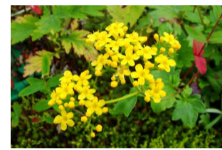
ハクサンオミナエシ