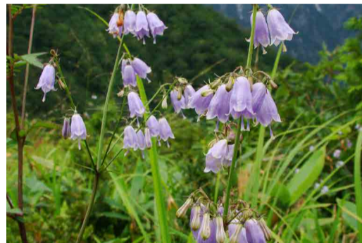
ハクサンシャジン