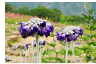
プリムラ・カピタータ