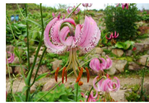
リリウム・ランコンゲンゼ