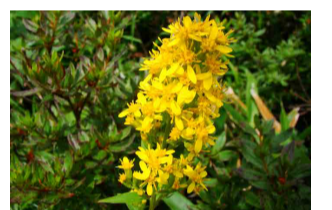
アキノキリンソウ