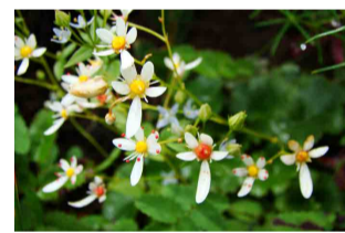
ミヤマダイヤモンドソウ