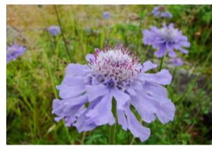
タカネマツムシソウ