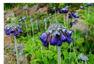
プリムラ・カピタータ