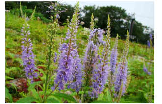
ヤマドリトラノオ