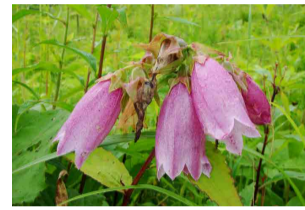
ヤマホタルブクロ