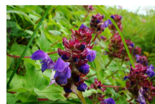
タテヤマウツボグサ