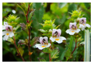
ミヤマコゴメグサ