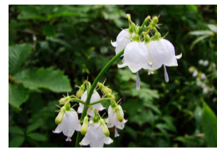
ハクサンシャジン