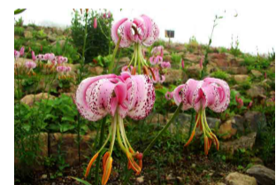
リリウム・ランコンゲンセ