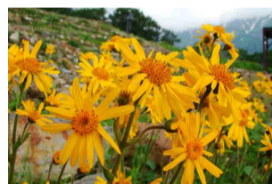
アルニカ・モンタナ