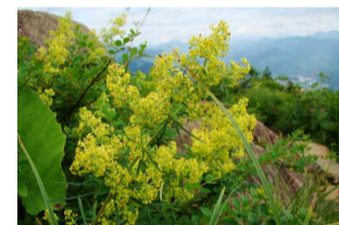
キバナカワラマツバ