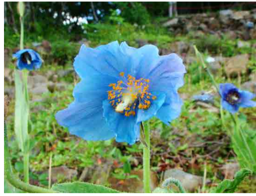
ヒマラヤの青いケシ

コマクサの花が多く咲き、見ごろ。園内では、ヒオウギアヤメ、タカネナデシコも見ごろです。ニッコウキスゲ、ハナチダケサシなども咲き始めています。エーデルワイスも咲き始め、外国の高山植物も楽しめます。