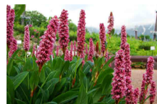
ヒマラヤトラノオ