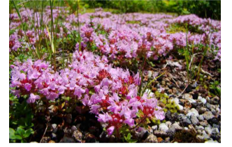
イブキジャコウソウ