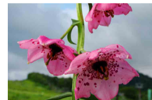
ノモカリス・フォレストィ