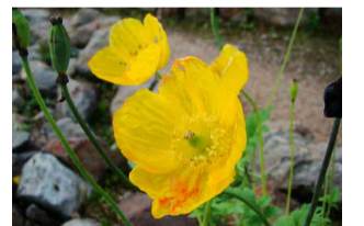
メコノプシス・カンブリカス