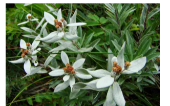
ハッポウウスユキシソウ