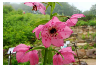
ノモカリス・フォレスティ