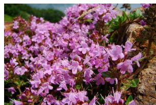
イブキジャコウソウ