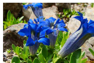
ゲンチアナ・ディナリカ