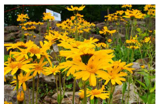
アルニカ・モンタナ