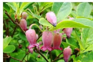
ウラジロヨウラク