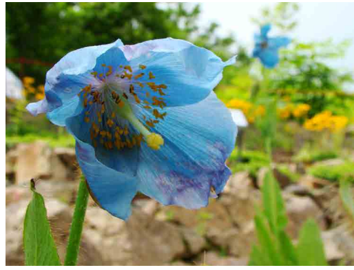
ヒマラヤの青いケシ

コマクサの花が見ごろです。群生になり、キレイです。 ヒマラヤの青いケシは、まだまだ、これから開花数は増えてきます。 ロックガーデンでは、外国の高山植物も楽しめます。 花の種類も増えてきました。園内上部までゆっくりお楽しみください。