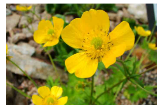
ミヤマキンポウゲ