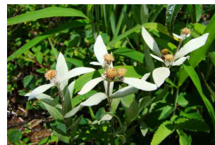
ハッポウウスユキソウ