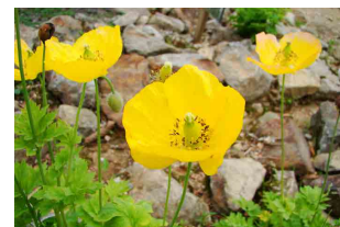
メコノプシス・カンブリカ