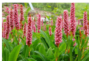
ヒマラヤトラノオ