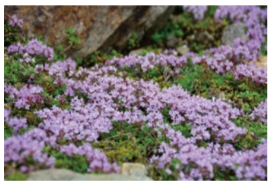
イブキジャコウソウ