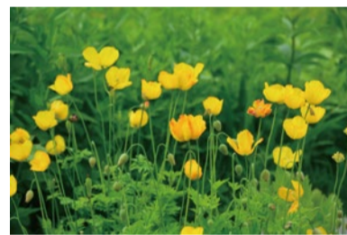
メコノプシス・カンブリカ