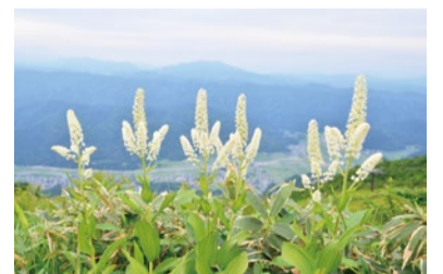
コバイケイソウ ※今年は当たり年です