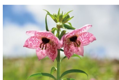
ノモカリス・フォレストイ