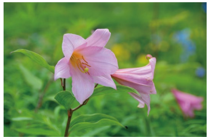
人気のピンクの花「ヒメサユリ」