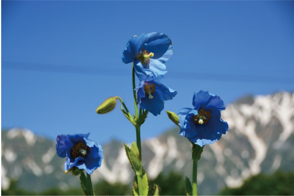
本格的に見頃のヒマラヤの青いケシ。

“ヒマラヤの青いケシ”がたくさん咲いて見ごろ。ロックガーデン、アルプス平広場などで綺麗な青色が見れます！！コマクサの花も増えていて群生地上部ではかなり見ごろです。