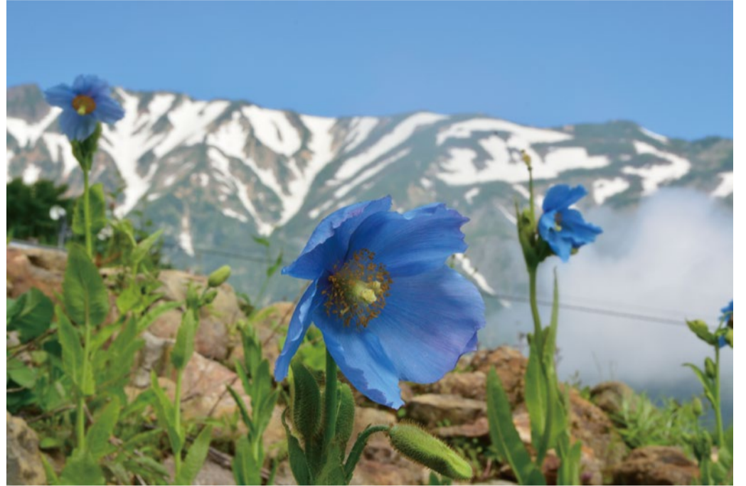
ところどころでどんどん花が増えていきます