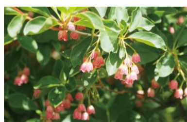
ベニサラサドウダン