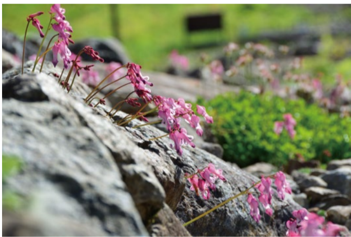
コマクサは上部の方がたくさん咲いていて見ごろです。