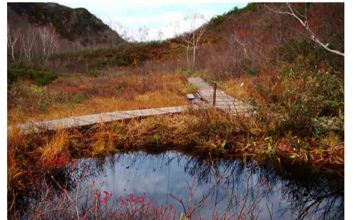
植物園から遊歩道へ