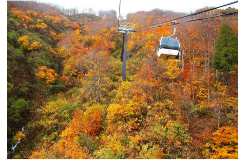
テレキャビン山頂付近