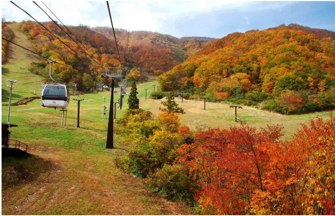
ゴンドラテレキャビン山頂付近