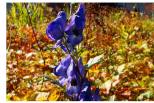
ミヤマトリカブト