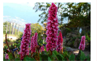
ヒマラヤトラノオ