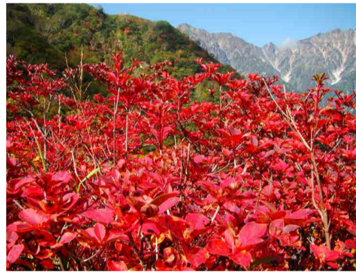
赤く色づいたツツジ