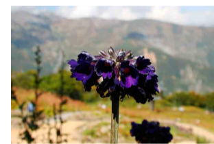
プリムラ・カピタータ