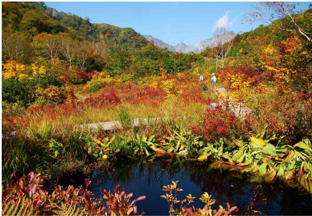
アルプス平自然遊歩道