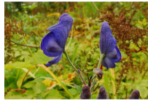
ミヤマトリカブト