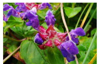
タテヤマウツボグサ