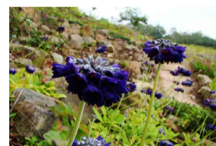
プリムラ・カピタータ