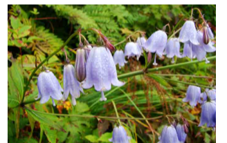
ハクサンシャジン