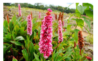
ヒマラヤトラノオ