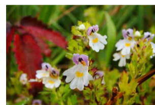
ミヤマコゴメグサ