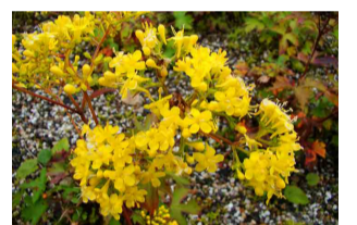
ハクサンオミナエシ