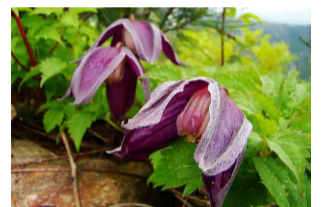
ミヤマハンショウヅル