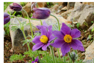
プルサティラ・ブルガリス