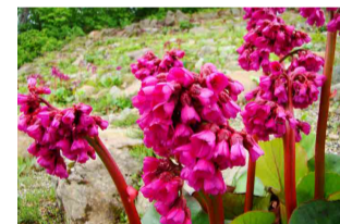
ベルゲニア・オメイエンシス