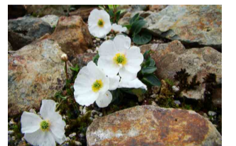
ランンキュラス・バルナシフォルリウス