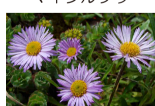
ミヤマアズマギク