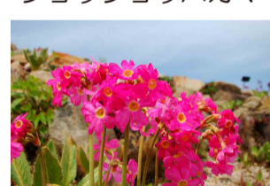
プリムラ・ロゼア