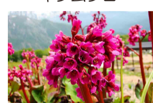
ベルゲニア・オメイエンシス