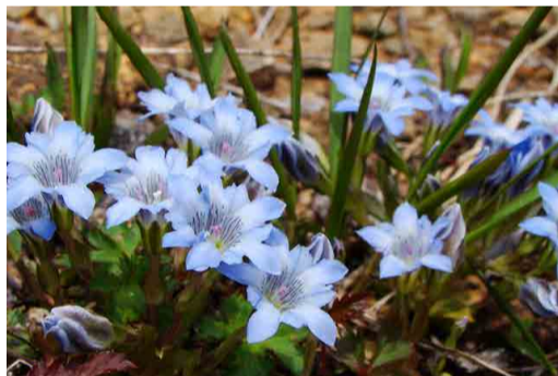
タテヤマリンドウ