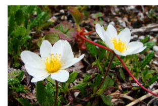
チョウノスケソウ