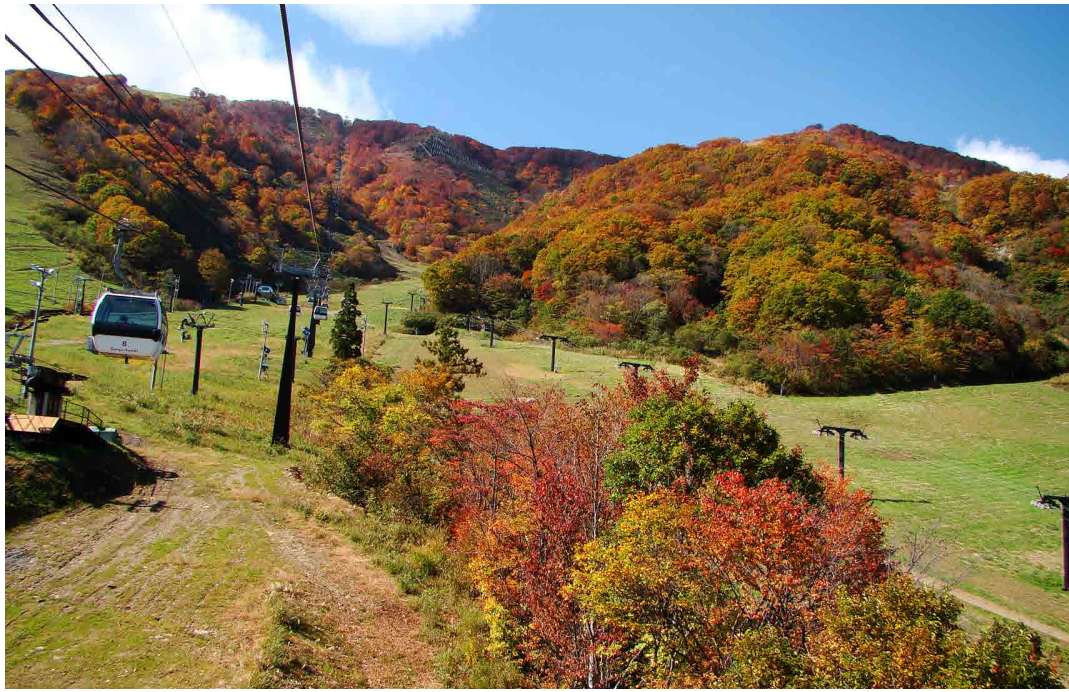
ゴンドラテレキャビン中腹付近