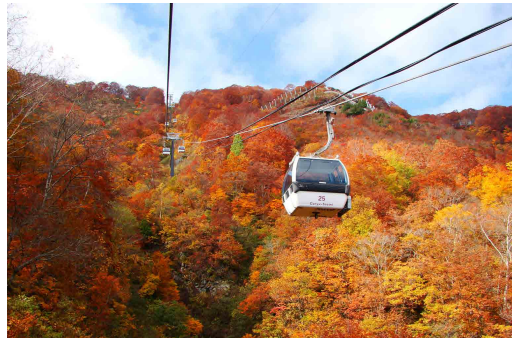
テレキャビン山頂付近

紅葉は、ゴンドラの山麓付近まで色づてき、ゴンドラ乗車中には、紅葉と景色を楽しめます。 今年の白馬五竜グリーンシーズン営業は、10月30までとなります。