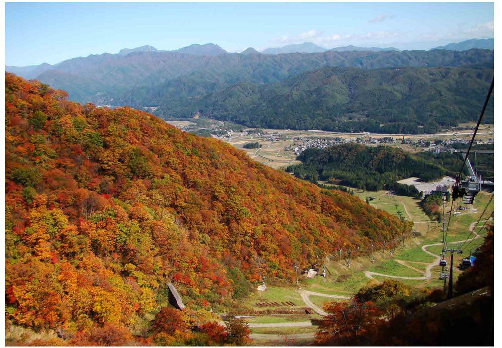
紅葉は山麓へと色づいてきました。