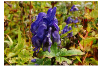
ミヤマトリカブト