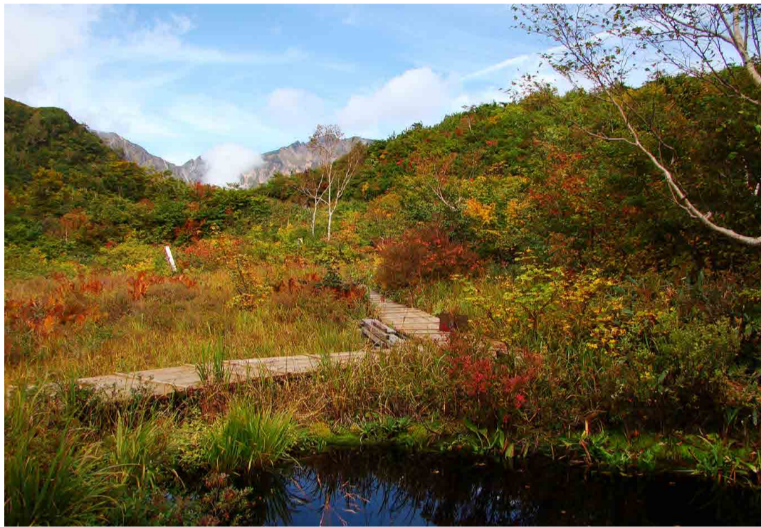
アルプス平自然遊歩道