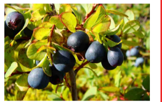
クロマメノキの実