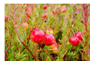
ツルコケモモの実