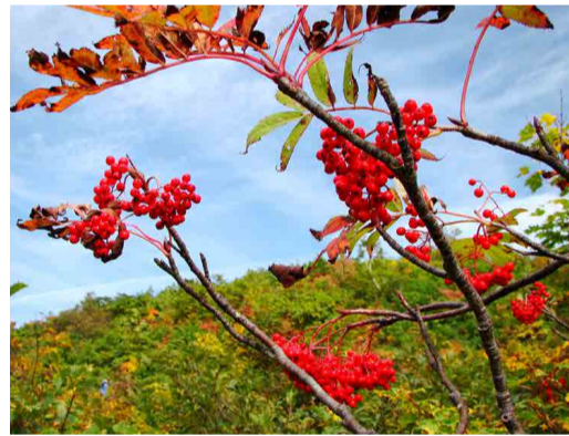
赤く色づいたナナカマドの実