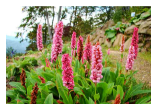
ヒマラヤトラノオ