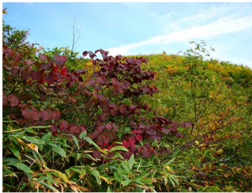
地蔵ケルン下部より